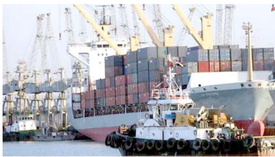
ميناء: سفن محملة بال بضائع ترسو في ائد الموانئ العراقية

في المناسبات الدينية). وأضاف ان (بعض خطوط الشركة أجبرت على التوقف بسبب الظروف الأمنية بعد الإعداد العائشي وبعد إعلان النصر والتحرير الكامل من قبل القوات الأمنية والحشد الشعبي وتم العمل على إعادة تشغيل الخطوط المتوقفة لخدمة أسر تلك المناطق وأهمها خط بغداد الموصل الذي ينقل المواطنين من مرابين في بغداد الأول مراب الكرخ الشمالي والثاني مراب النخبة إلى الجانب الأيمن (الجنوبي) والموصل وبالعكس). وأكد لعبيبي انه (تم إعادة تشغيل خط بغداد -عنه لتقديم خدمة النقل لاهالي القضاء والمحافظه من مراب الكرخ الشمالي في منطقة العلاوي ببغداد). وأشار الى ان (الشركة ماضية بسعيها في تطوير واقع النقل داخل بغداد والمحافظات وكذلك النقل الدولي بين العراق والسودان المجاورة).