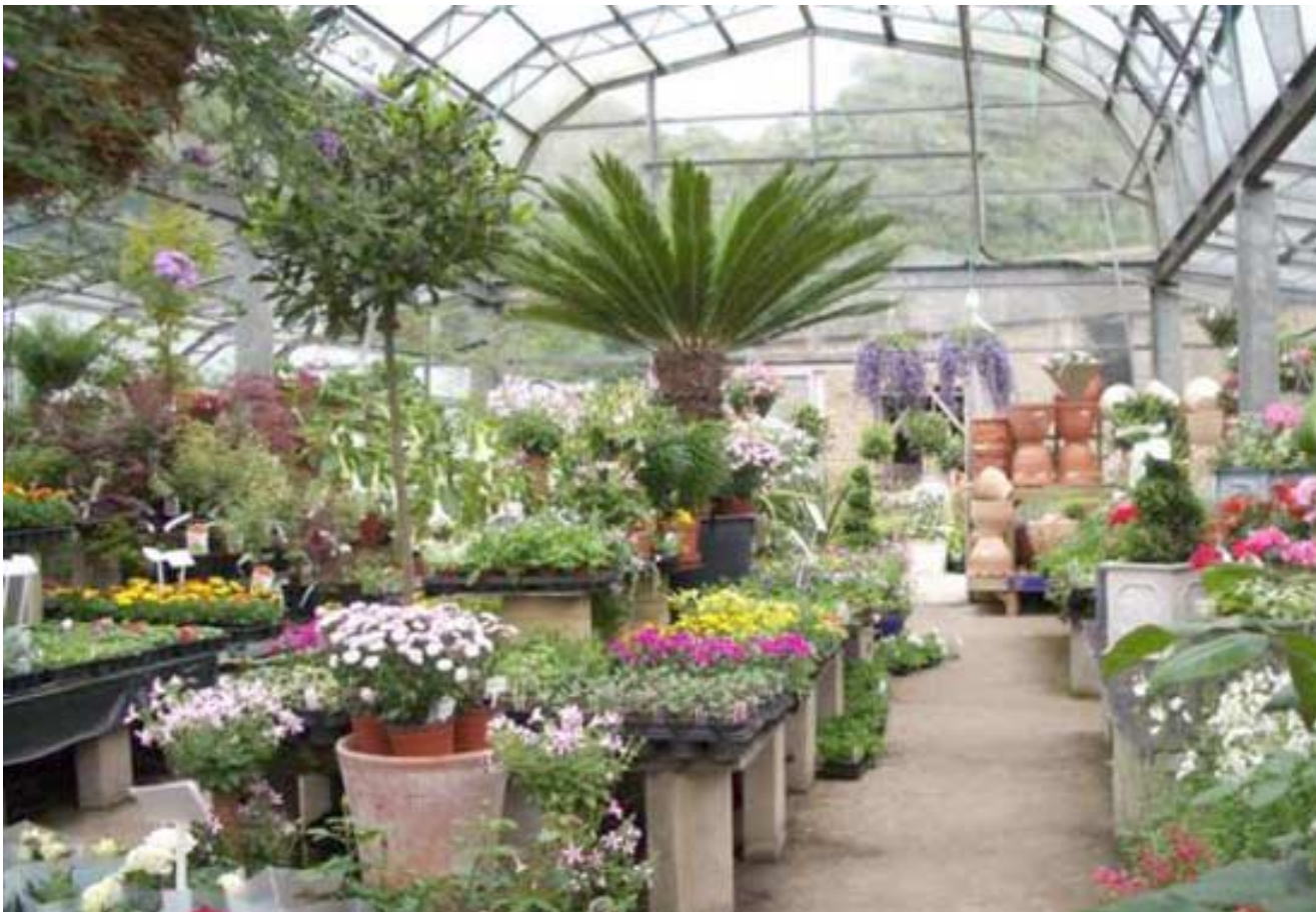
مشتل ، جانب من إحدى المشاتل التي تم تطويرها في إيسر الموصل

به المنظر الجمالي فإنها تمنع الانتشار من الانتشار سوداء قاتمة مرت بها هذه المدينة العريقة).