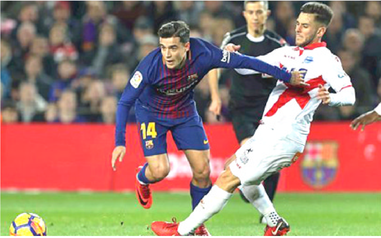
صعوبة: واجه فريق برشلونة صعوبة كبيرة في الفوز على فريق الأفييس في الليجا

التي أقيمت بينهما على ملعب كامب نو، مساء أول أمس الأحد، في الجولة الحادية والعشرين لل دوري الإسباني، تقدم الأفييس في الدقيقة 23 عن طريق المهاجم جون جيديتي وتعادل برشلونة في ثم أحرز ليونيل ميسي هدف الفوز في الدقيقة 84. ورفع برشلونة رصيده بهذا الفوز إلى 57 نقطة في صدارة الترتيب بقيادة مديره الفني إرنستو فاليريدي وتجمد رصيده الأفييس عند 19 نقطة في المركز السابع عشر مع مديره الفني أيلارو فيرنانديز. جاءت المباراة مشيرة في مجملها، وسيطر برشلونة على مجريات الأمور منذ الدقائق الأولى بتمريرات متبادلة وبدات المحاولات عن طريق لويس سواريز ولجا فريق الأفييس إلى الدفاع المحكم ليتجاوز حتى البداية. وبدأ الأفييس تنظيم الهجمات المرتدة السريعة وكاد أن يخطف هدفاً في الدقيقة 11 لولا تالف الحارس الألماني تير شتجن الذي أنقذ الموقف بعدما انفرد جيديتي بالرمي ولكنه سد في جسم الحارس. جاءت كرة أخرى الضيوف وأقذ باشتيكو حارس الأفييس هدفاً من كرة عرضية خطيرة ثم تسديدة من جانب فيليب كوتيتو مرت بجوار القائم. حصل مارك وكاسو على الإنذار المخشونة في الدقيقة 22، ونجح الأفييس في تسجيل هدف التقدم في الدقيقة 23 عن طريق جون جيديتي الذي استغل تمريرة في عمق الدفاع مسدداً في مرمي تير شتجن. كاد الأفييس أن يسجل مرة أخرى لولا تالف الحارس الألماني قبل أن تتحول دفة المباراة تماماً لصالح برشلونة، وأحرز ليونيل ميسي فرصة قريبة بتسديدة مرت بجوار القائم ببعض تسديرات، وفرصة أخرى من كوتيتو وأضاع سواريز محاولة فوق العارضة لينتهي الشوط الأول بتقدم الأفييس. الشوط الثاني سار في اتجاه واحد، في ظل أداء هجومي ضاغط من برشلونة منذ الدقائق الأولى، وتدخل فاليريدي في تشكيل برشلونة بنزول ظهيري جنب وهما سيرجي روبرتو وجوردي ألبا على حساب تيلسون