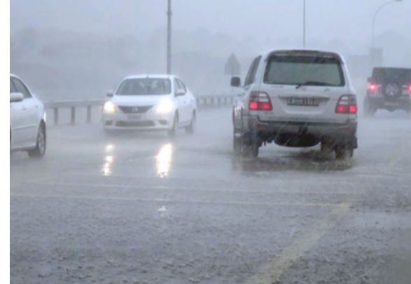
أمتار ثغمر شوارع بغداد

غائم جزئي واوضح البيان ان (طقس يوم غد الثلاثاء سيكون في الوسطى غائماً جزئياً، ودرجات الحرارة ترتفع بضع درجات عن اليوم السابق، وفي الشمالية غائماً جزئياً يتحول تدريجياً إلى غائم ضحواً يتساقط امطار خلال الليل مع فرصة لحدوث عواصف رعدية، ودرجات الحرارة مقاربة لليوم السابق كما يتساقط الضباب في الصباح الباكر ويكون كثيفاً في بعض الاساقن ثم يزول تدريجياً خلال النهار، ودرجات الحرارة مقاربة لليوم السابق، وفي