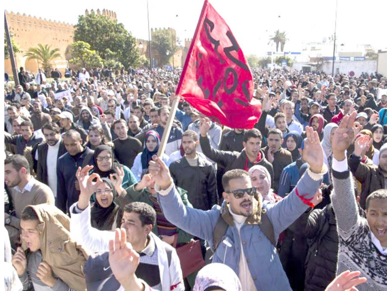
تظاهرات : مغارية في تظاهرات للمطالبة بالإصلاح والعمل

يشارك في مؤتمر إقليمي يعقد اليوم الإثنين وغدا الثلاثاء المقبلين في مراكش بالمغرب، سبل مواجهة مشاعر الإحباط في بعض بلدان المغرب العربي والشرق الأوسط والإصلاحات الواجب القيام بها. ويقول مدير قسم الشرق الأوسط العربي والشرق الأوسط والإصلاحات الواجب القيام بها. ويقول مدير قسم الشرق الأوسط العربي والشرق الأوسط والإصلاحات الواجب القيام بها. ويقول مدير قسم الشرق الأوسط العربي والشرق الأوسط والإصلاحات الواجب القيام بها.