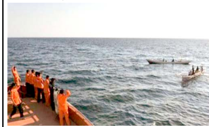
بحث سفن بحرية تبحث عن العبقارة المفقودة في المحيط الهادي