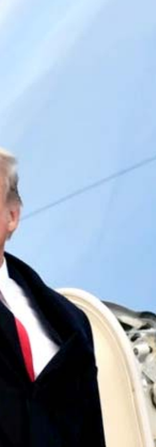
عودة الرئيس الأمريكي دونالد ترامب قبل صعوده من الطائرة الرئاسية وعودته من سويسرا الى الولايات المتحدة

□ وكان من المتوقع ان تستغرق الرحلة التي يبلغ طولها 260 كيلومتر مدة يومين. وقال مركز تنسيق عمليات الإنقاذ النيوزيلندي "نعرف ان المركب خضع لإصلاحات قبل انطلاقه". وأضاف "هذا قد يكون ساهم في مشاكل اجار المركب". وأشار الى ان "الطقس في هذا الجزء من المحيط الهادي حالياً معتدل مع بعض التقلبات". وكلفت السلطات النيوزيلندية طائرة اوريون تابعة لقواتها الجوية مسح الطريق الذي كان من المقرر ان تسلكه العبقارة.