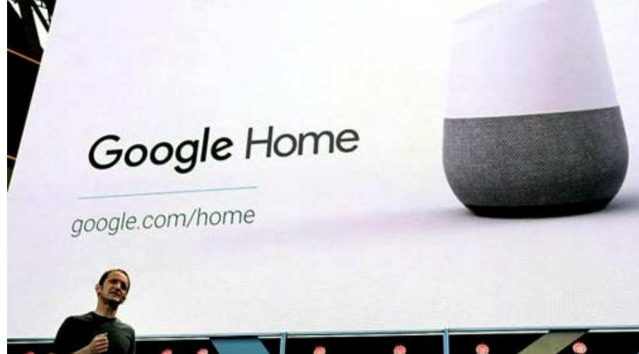
غوجل هدم خلفية لمؤتمر الشركة

واشنطن - مرسي ابو طوق كشفت شركة غوجل عن إصلاح خلل في مشغل الوسائط كرومكاست، والأجهزة التي تعمل بنظام تشغيل اندرويد، قد يعطل فجأة شبكات الإنترنت اللاسلكي المنزلية (واي فاي)، وتظهر المشكلة، عندما تستعيد أجهزة كرومكاست واجهزة مكبر الصوت الذي "غوجل هوم" نشاطها، من حالة "السكون" المصاحبة لانخفاض مستوى الطاقة. وحينما تستيقظ الأجهزة قد تنقل أكثر من 100 ألف حزمة من البيانات، تغمر سريعا اجهزة توجيه الإنترنت المنزلية "روتزر".