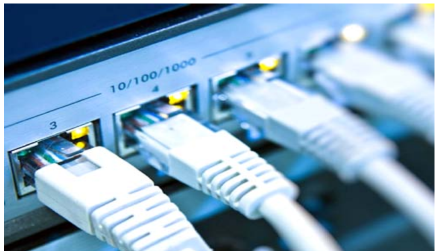
اجهزة ساعات الانترنت

وأوضحت الدائرة أن (عمليات التهريب التي تم ضبطها في المشروع وصلت إلى 47 لدا، إذ تبلغ كلفة اللدا الواحدة مليون دولار أمريكي شهرياً، مما يعني أن مجموع الكلفة المهربة التي تم ضبطها تبلغ 47 مليون دولار). وأشارت إلى أن عملية الضبط أسفرت عن التحرز على أجهزة التراسل الخاصة بعملية التهريب، فضلاً عن ضبط مدير موقع [إيرتلنك] في المحافظة، وتم تقديم محضر ضبط أصولي ضم جميع المبررات الجرمية المصنوبة وتصوير المخالفات المشخصة فديويًا، وتم عرضها على قاضي التحقيق المختص.