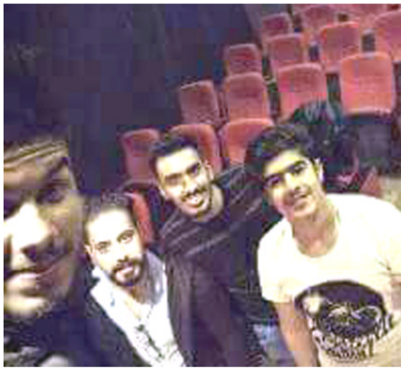
عمل جديد: أسرة (آخر نسخة منه) في كواليس المسرح (الزمان)