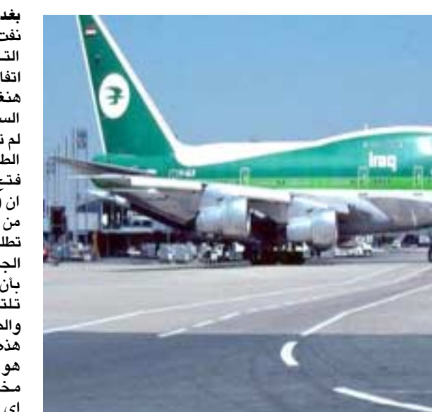
مطار: طائرة عراقية جامئة في مطار دولي

بغداد- شيماء عادل نفت سلطة الطيران المدني العراقي التابعة لوزارة النقل وجود اي اتفاقيات رسمية بشأن افتتاح خطي هونغاريا وصربيا . وقال مصدر في السلطة لـ(الزمان) ان (الشركة لم تلتق اي طلب رسمي من سلطة الطيران الهونغارية والصربية بشأن فتح خط جوي مع العراق). مبينا ان سلطة الطيران تسلمت رسالة من احد شركات الطيران الهونغارية تطلب فتح خط جوي معها ولكن الجهات العراقية ردت على الرسالة بان سلطة الطيران المدني تحتاج ان تلتقى بتظلماتها الهونغارية والصربية لبحثها بالموافقة على قيام الطائرات العراقية بنقل المسافرين من سوريا الى اي دولة في العالم على ان تجسد تلك الطائرات رحلاتها من العراق او تنتهي به) مشيرة الى ان (ذلك