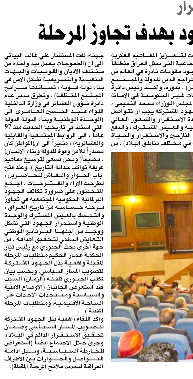
مؤتمراً: جانب من مؤتمر التعايش الذي نظمه البرلمان