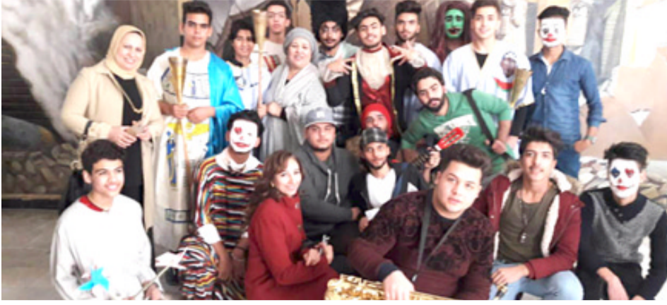
طلبة قسم الفنون المسرحية يقدمون (المهرج) (الزمان)