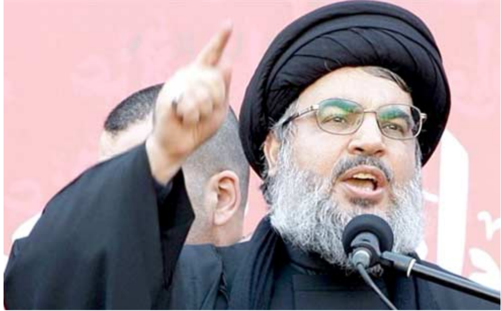
حسن نصر الله

شمال سوريا، والتي سميها الإحرام زوج أفا، أي "عرب كردستان" التي تصريح القيادي الكردي بعيد ساعات من قول اردوغان في خطاب أمام نواب حزبه في أقرة عدا أو بعده، قريباً مستخلص من أوكار الإرهابين، واحداً تلو الآخر في سوريا، بدءاً من دمشق وعربان. تقع المدينتان في مناطق خاضعة لوجودات حماية الشعب الكردية، العمود الفقري لقوات سوريا الديمقراطية، إلا أن أقرة للدفاع عن روج أفا، على إعلان الرئيس التركي رجب طيب أردوغان الثلاثاء أن قواته ستنحتل قريباً المناطق الخاضعة لسيطرة الميليشيات الكردية في شمال سوريا وقال حمو في مقابلة نشرتها وكالة فرانس برس في دمشق، "نحن نرى أن قواته جاهزة للدفاع عن روج أفا، وعربان تحديداً، كائنات من كان القائم بالهجوم على هذه المنطقة الكردية في