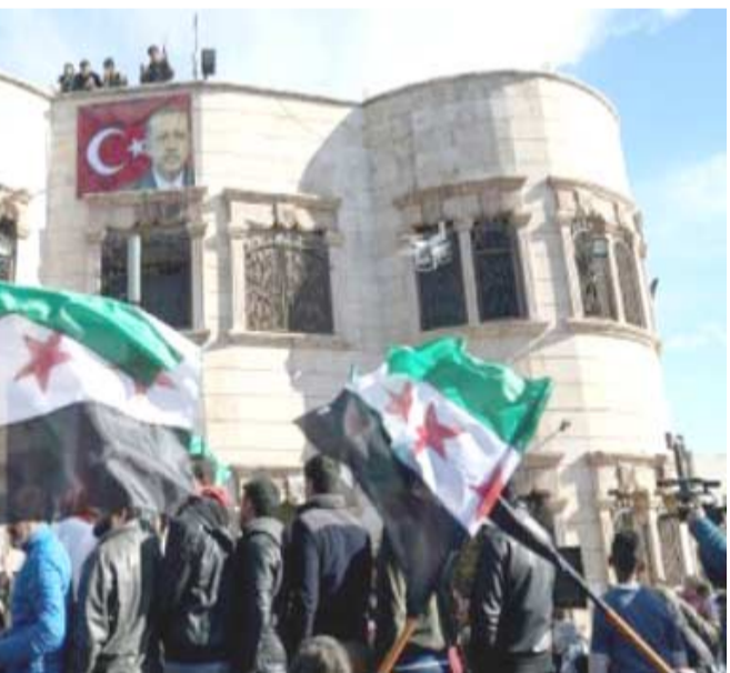
سوريون يتظاهرون في اعزاز لتأييد العمليات التركية ضد مواقع لوجودات حماية الشعب الكردية

وكان ترامب أعلن في 6 كانون الأول/ديسمبر 2017 اعترافه بالقدس عاصمة لإسرائيل. واثار هذا القرار الاحادي غضب القيادة الفلسطينية التي قررت تجديد الاتصالات مع المسؤولين الأميركيين مؤكدة ان