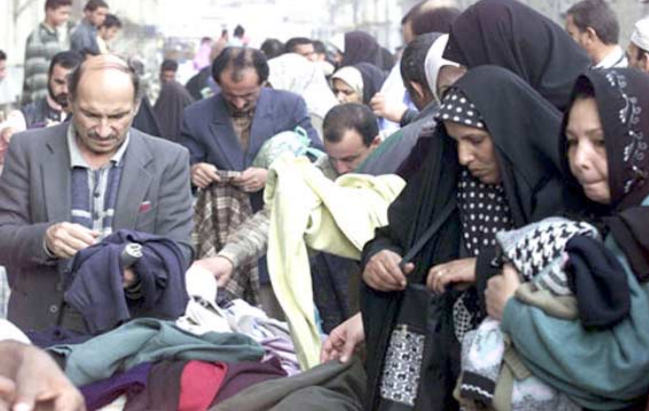
سوق : جانب من المواطنين في سوق بيع الملابس القديمة

نساتية او ملابس اطفال كما ان حركة السوق لها اصحت في تزايد وهذا يعود لرخص اسعارها مقارنة بالاسعار التي يبيعها اصحاب محلات الملابس على المواطنين ومن هنا اصبح هذا السوق في وضع