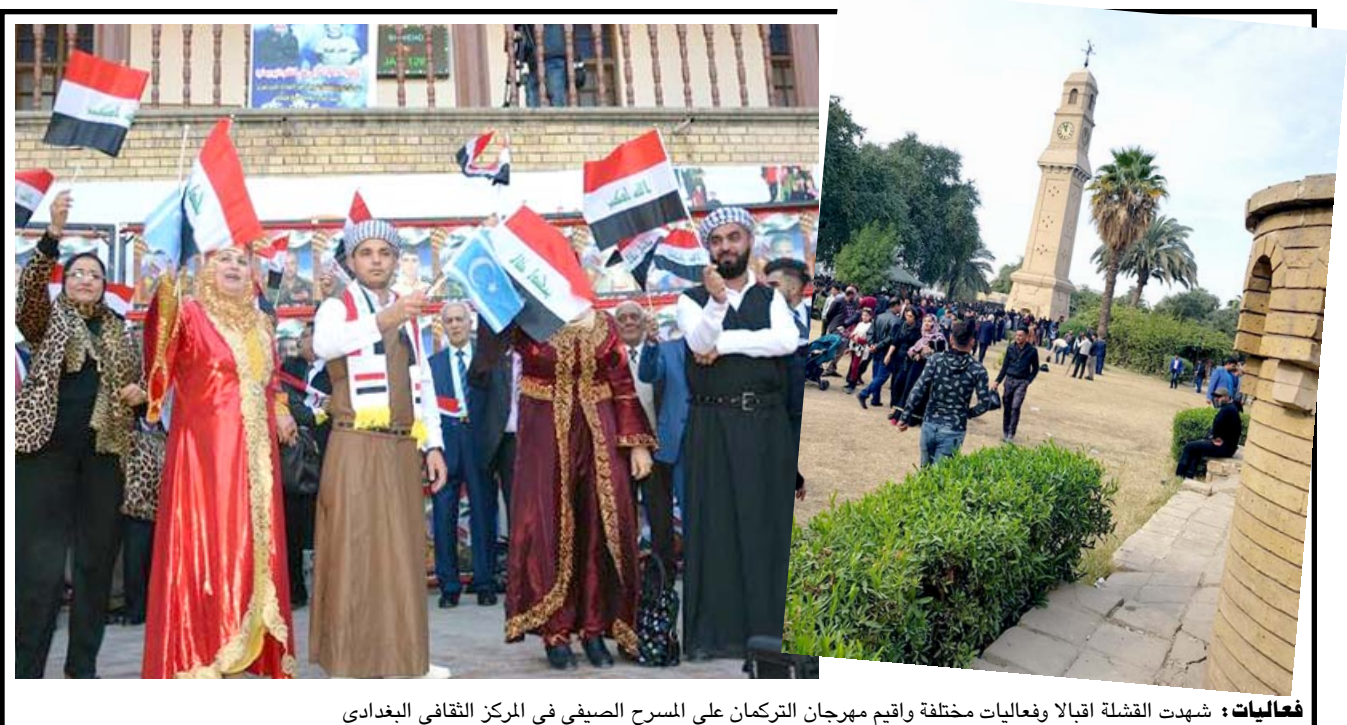
فعاليات: شهد القشلة اقبالا وفعاليات مختلفة واقام مهرجان الترمكان على المسرح الصيفي في المركز الثقافي البغدادي

وأوضح وليد ان (الإجراءات التي تقوم المديرية بتطبيقها ضد مخالفين هذا القانون تصل الى الغرامة والبالغ مقداره 15 الف دينار كون استخدام الهاتف أثناء القيادة قد