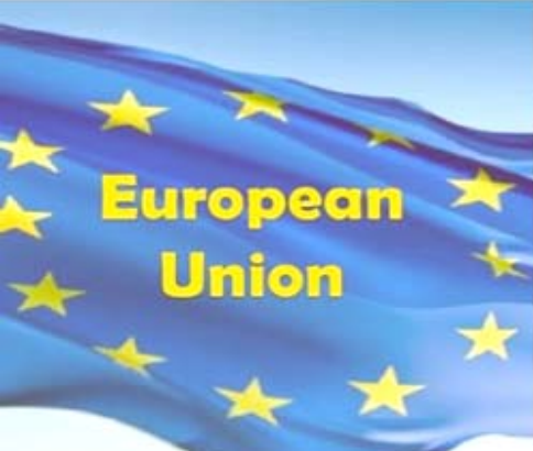
شعار الاتحاد الوري

وأضاف انه (خلال الرحلة انخرفت العالج مؤكدة حرصها على سلامة عودة جميع النازحين طوعا الى ديارهم).