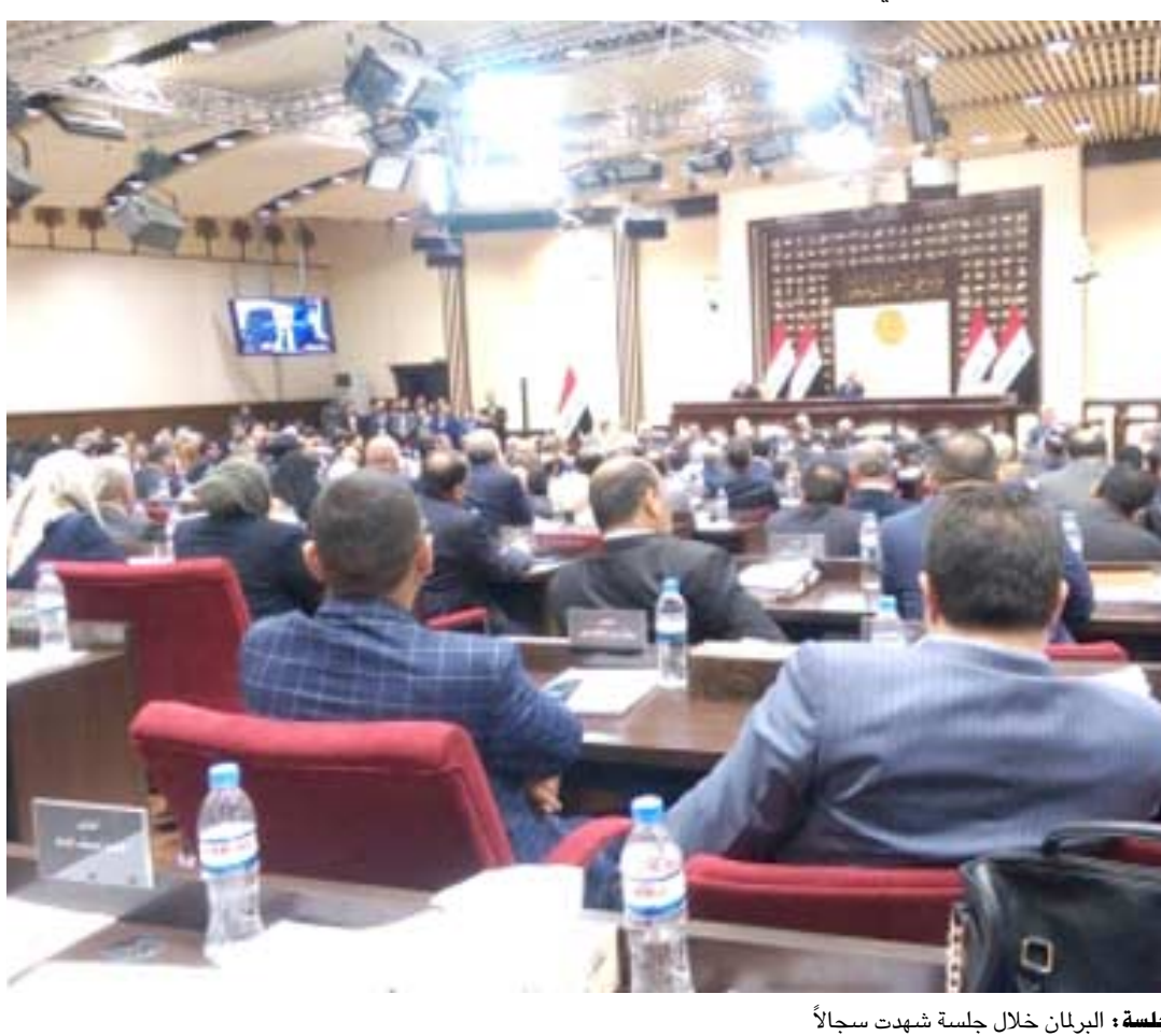
جلسة : البرلمان خلال جلسة شهدت سجلاً