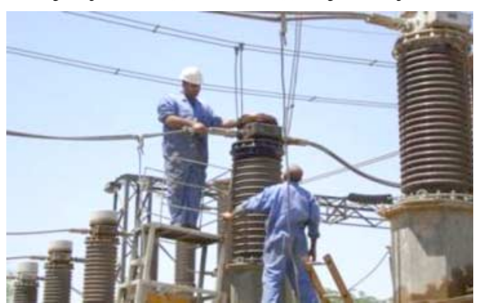
تاهيل: ملاكات الكهرباء، تؤول محطة العمل

المعدة بشأن تدريب الملاكات في محافظات بغداد ونيوى والبصرة لشرح مفهوم مشروع الشراكة مع القطاع الخاص