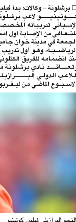
النجم البرازيلي فيليب كوتينيو

دونا الكشف عن قيمة الصفقة، فيما سيغيب كوتينيو لمدة عشرين يوماً بسبب معاناته من إصابة في الفخذ الامين. كوتينيو في ملعب كامب نو شاهدة المباراة التي جرت بين برشلونة وسيلتا فيجو في ايام المنتخب الإسباني مع بطولة كاس إسبانيا لكرة القدم.