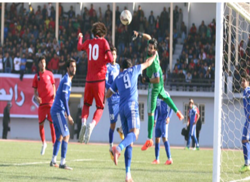
الفرق الصاعدة للممتاز تدخل في صراع الاقوياء.