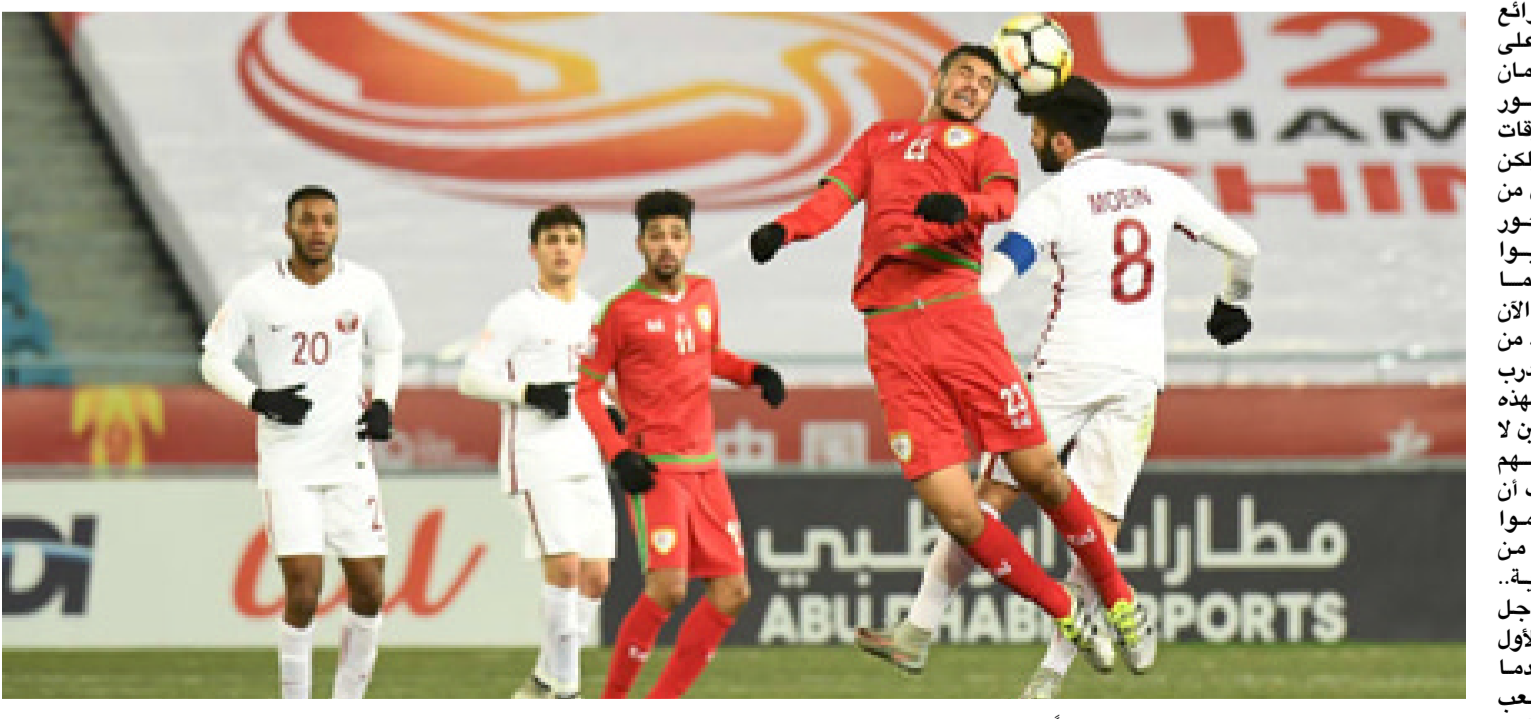
جانب من بطولة اسيا تحت 23 سنة الجارية حالياً في الصين