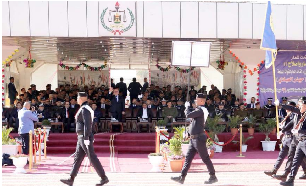
استعراض : ثلثة من عناصر الشرطة تستعرض أمام رئيس الوزراء بمناسبة عيدها اول امس

الحواضر المهمة لتصدير السلاح العراقي ( . وبين الاسم ان الانتاج الحربي في البلاد سينتهي هجر ملايين من الفواتير امينة لحماية مطار بغداد وان كلاب جي تايين الكلفة بالثمن في المطار غير صالحة للعمل. وبسبب احدى الوثائق فان الكلاب ليس لديها منشأ اجنبي في 2015 (شركة في فور اس البريطانية لا تحمل شهادات تدريب الكلاب في نايين البالغ عددها 38 كلبا بوليسيا مخصصة بكفص المنقذات. وانها غير صالحة للعمل فيها كلابا غير متناسقة. وتضمنت الوثائق تقريرا بشأن نتائج فحص الكلاب التي يفترض انها بوليسية ومبرية على كنف المتفجرات ان (احد اسباب ضعف