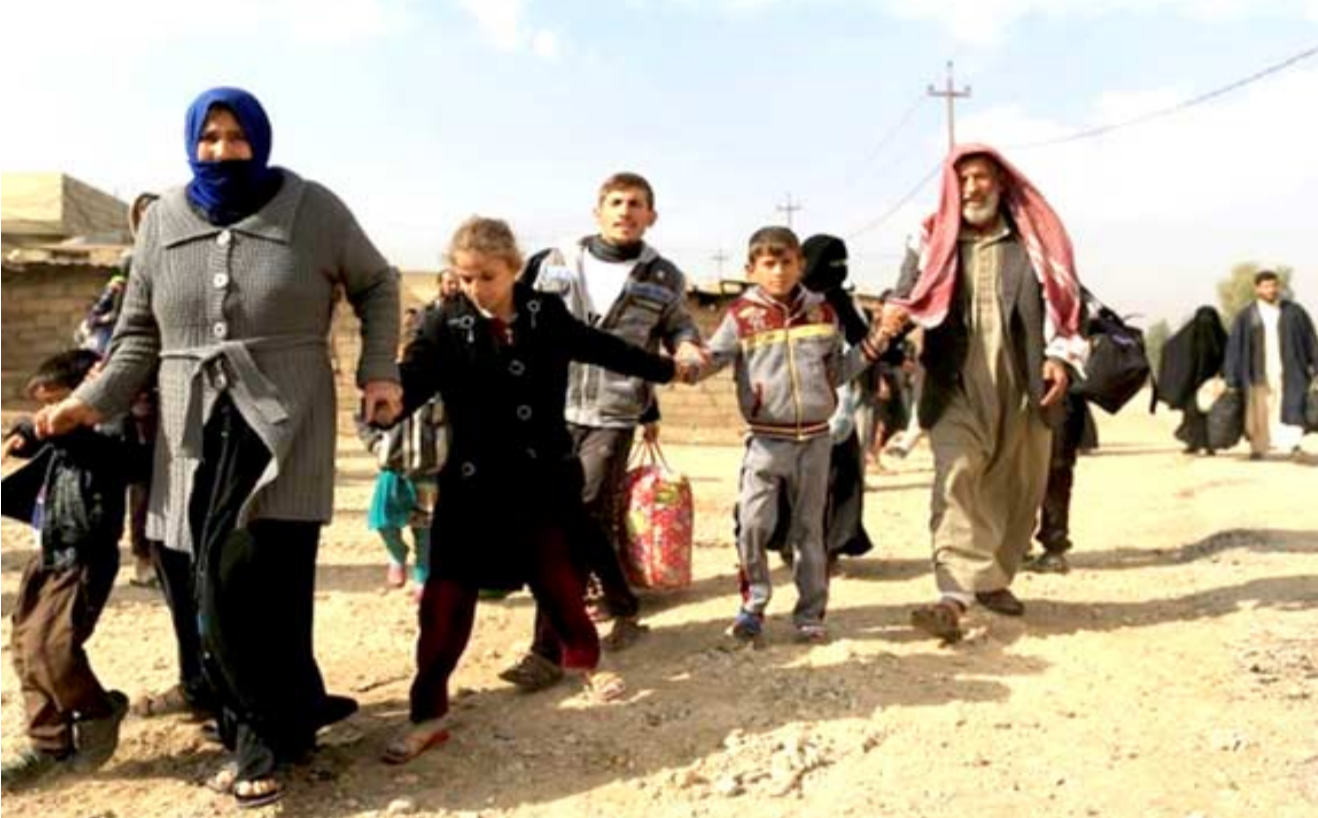
زوج: اسر نازحة تعود إلى ديارها في الانبار