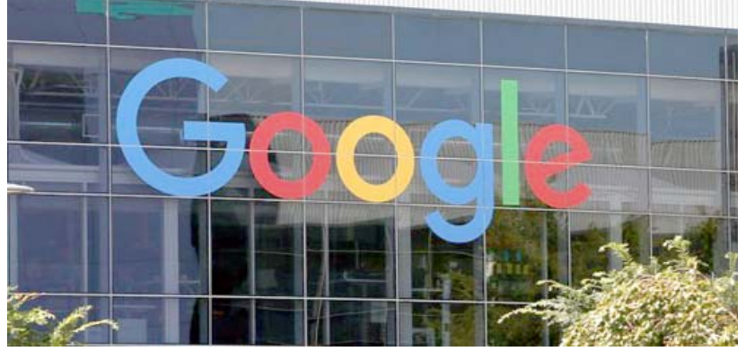
مبنى شركة غوغل

وفي الدعوى، قال السيد دامور إن المذكرة كان يفترض أن تظل داخلية، وكتبت رداً على طلب ملاحظات على مؤتمر التنوع والشمول الذي حضره. وحينما أقبل دامور من وظيفته، قال الرئيس التنفيذي لشركة غوغل، ساندر بيتشاي، إن أجزاء من المذكرة انتهكت القواعد السلوكية للشركة، وتجاوزت الحدود من خلال افتراض قوالب نمطية مسبقة وضارة على أساس الجنس، في مكان عملنا. لكن دامور قال إنه تلقى الكثير من الرسائل الشخصية، من زملائه في غوغل، عبروا فيها عن امتنانهم له، لحديثه عن هذه المسألة بشكل علني.