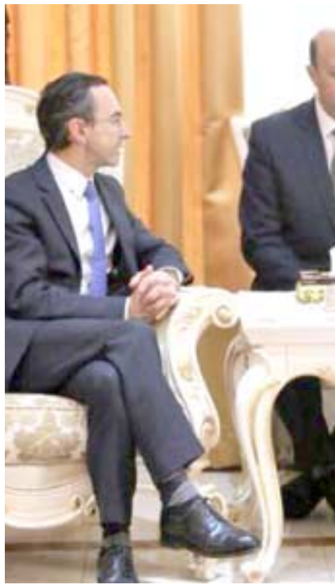
رئيس مجلس البرلمان خلال استقباله وفدا من مجلس الشيوخ الفرنسي

داعش)، مشيرا الى ان (هناك فريقا هندسيا يرافقتنا سيعمل على تحديد حجم الاضرار من اجل وضع توقيتات زمنية محددة لاعادة اعمار جسور الموصل الى الخدمة).