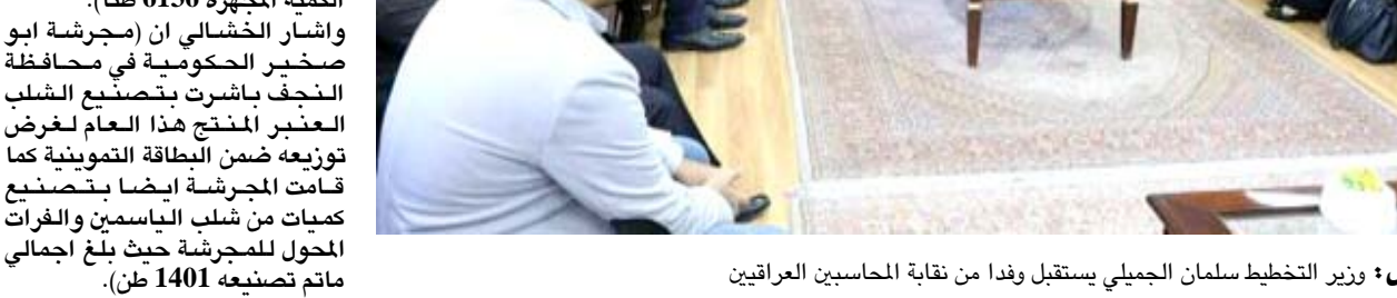
استقبال وزير التخطيط سلمان الجميلي يستقبل وفدا من نقابة المحاسبين العراقيين

إعطاء الكمية المجهزة 48 طنا وضمن الحصص التعمينية حيث تم توزيعها بين العوائل النازحة الموجودة في المحافظة وحسب البيانات الخاصة بتلك العوائل كما باشر الفرع ايضا باستلام وتجهيز الرز الفيتنامي والرز المحلي إلى الوكلاء ضمن الحصص التعمينية حيث بلغت الكمية المجهزة 6136 طنا). وأشار الخشالي ان (مجرشة ابو صخير الحكومية في محافظة النجف باشرت بتصنيع الشلب العنبر المنتج هذا العام لغرض توزيعه ضمن البطاقة التعمينية كما قامت المجرشة ايضا بتصنيع كميات من شلب الرسامين والفرات الخلل للمجرشة حيث بلغ إجمالي ماتم تصنيعه 1401 طن).