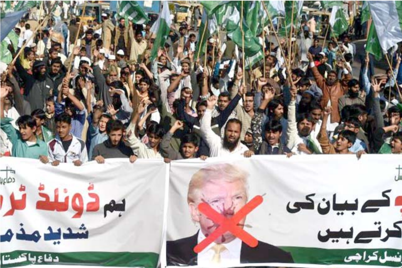
تظاهرات : باكستانيون يخرجون بمظاهرة احتجاجية ضد قرار ترامب نقل سفارته الى القدس

وتأتي رسائل الكراهية وسط تصاعد التوتر في المجتمع النمساوي حيال قضايا الاسلام بشكل عام وتدفق المهاجرين إلى أوروبا بشكل خاص.