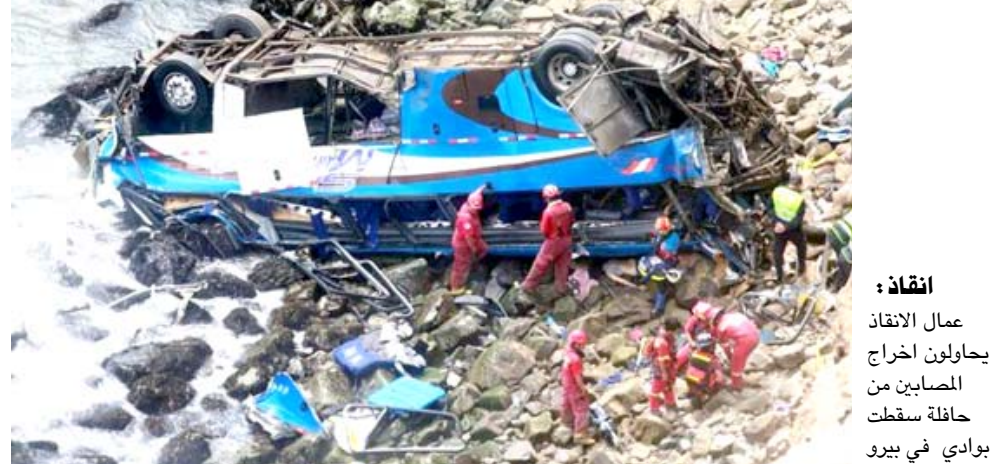
انقاص: عمال الانقاذ يحاولون اخراج الصابيين من حافلة سقطت بوادي في بيرو

ليما، (ا ف ب) - قضى 48 شخصاً على الأقل أمس في البيرو جراء سقوط حافلة على متنها 57 شخصاً من علو ارتفاع يناهز مئة متر وتحطمها فوق شاطئ صخري بعدما اصطدمت بها شاحنة وقذفتها من اعلى طريق سريع شمال ليما، وفق ما افادت الشرطة. وقالت الشرطة في بيان نشرته وزارة الداخلية على موقعها الإلكتروني إن حادثاً سقطت الحافلة (...) وقع 48 قتيلاً على الأقل، مشيرة إلى أن عمليات انتشال الجثث توقفت بسبب هبوط الليل ووصول المد البحري إلى مكان حطام الحافلة. وكانت حافلة سابقة اوردها قائد