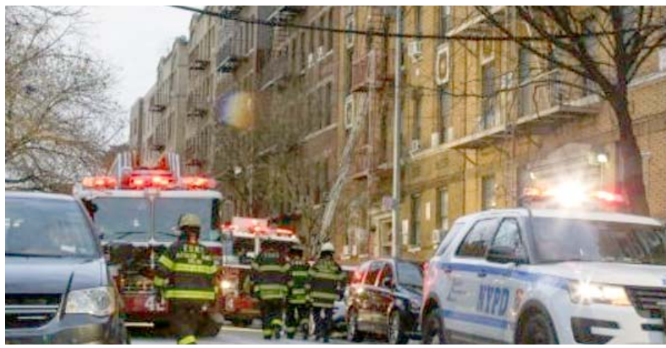
حريق: عناصر من فرق الاطفاء يخدمون حريقاً في مبنى سكني بحي بروكس في نيويورك

نيويورك، (ا ف ب) - أوقع حريق اندلع فجر الثلاثاء في مبنى بحي بروكس النيويوركي 23 جريحاً بينهم تسعة أطفال، في كارثة تأتي بعيداً أيام من مقتل 12 شخصاً في الحي نفسه في أسوأ حريق تشهده نيويورك منذ ربع قرن. وقال قائد فرق الإطفاء في نيويورك دانيال نيجرو في مؤتمر صحافي أمس لدى وصولها، وجدت فرقنا نفسها أمام حريق قوي لقد أضعف عناصر الإطفاء العديد من الأشخاص في المكان. من جهته قال المتحدث باسم فرق الإطفاء لوكالية فرانس برس إن أربعة من الجرحى أصابتهم بالغة إرواحهم في حطاب، في حين إن الجرحى الـ 19 الأخرين وبينهم طفاني، أصابتهم طفيفة. وبعد أربع دقائق من تلعنهم الإخطار قرابة الساعة 05.30 (10.30 ت غ)، هرع نحو 200 عنصر اطفاء وثلاثين شاحنة إلى المبنى القريب من حديقة حيوانات بروكس الشهيرة، لمكافحة السنة اللهب التي كانت تلتهم المبنى المشيد بحجارة القرميد، على غرار المئات من مباني نيويورك. هروب الأولاد وروى أحد سكان المبنى لشبكة 'ان بي سي نيوز' التلفزيونية كيف هرب مع أولاده الثلاثة، عراة الصدر ومن دون أحذية في طقس الفجر البارد، في وقت بلغت الحرارة عشر درجات مئوية تحت الصفر. وحسب الشبكة نفسها فإن