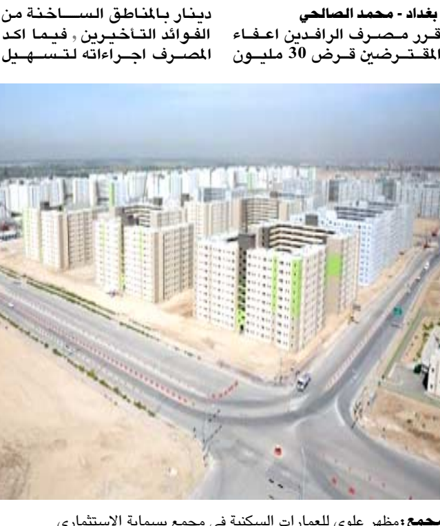
مجمع مظهر علوي للمعالم السكنية في مجمع بسماية الاستثماري

بغداد - محمد الصالح قرر مصرف الرافدين اعفاء المقترضين قرض 30 مليون دينار بالمناطق الساخنة من الفوائد التأخيرية، فيما أكد المصرف اجراءاته لتسهيل