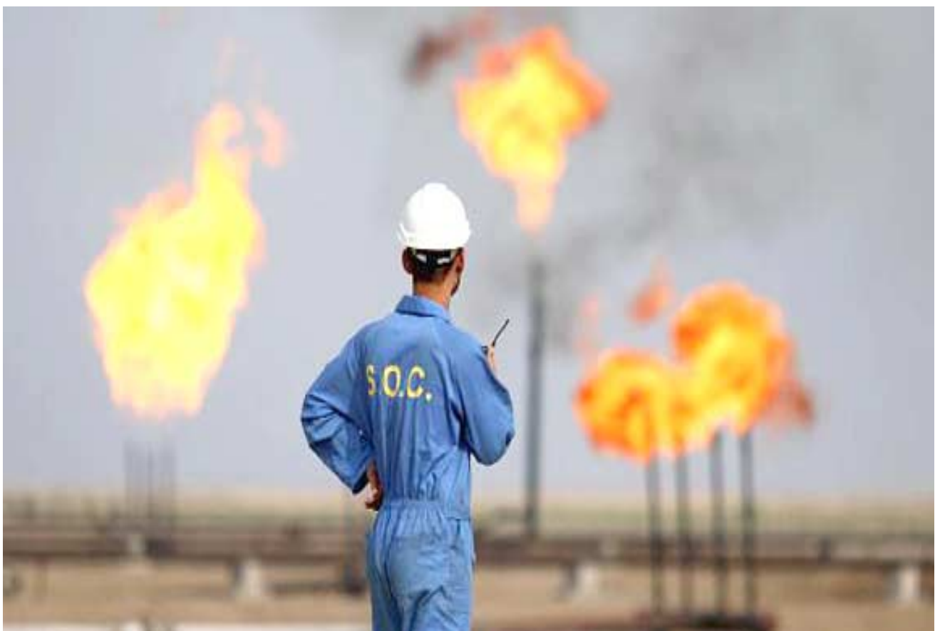
محل: عامل عراقي في حقل للغاز في الجنوب

بغداد - شيمة عادل أعلنت وزارة النفط عن تحقيق زيادة في استثمار الغاز الخام في مشروع غاز البصرة بنسبة 80 بالمئة مع تحقيق استثمار 230 مليون دولار من حقول الجنوب ومحافظتي ميسان، وقال وزير النفط جبار علي العيبي في بيان (العراق حقق زيادة غير مسبوقة في استثمار الغاز الخام المصاحب للعمليات النفطية في مشروع غاز البصرة بنسبة تصل إلى 80 بالمئة في مطلع شهر كانون الثاني من العام الجديد 2018 مقارنة بنفس الشهر من العام 2017)، وأضاف أن (القدرات الاستثمارية لهذا المشروع وصل إلى معدل 900 مقيم باليوم).