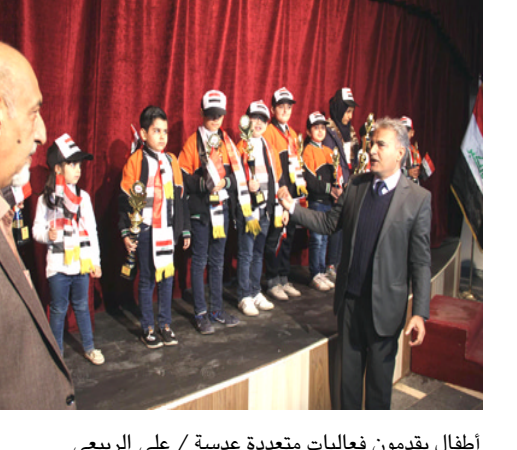
أطفال يقدمون فعاليات متعددة

بغداد - إلتصاح العامي قبيل اختتام عام 2017 لإبامه احققت دار ثقافة الأطفال بايقادها شمعتها الـ 48 باحتفالية تضمنت فعاليات عدة منها افتتاح وكيل وزارة الثقافة والسياحة والآثار جابر الجابري معرض السلسلة التاريخية المجلي والزمان الذي ضم ايضا في اروقته عرض دمي لشعبة الفنون الدرامية فضلا عن لوحات بيتت جانباً من نشاطات قسم العلاقات والاعلام وقسم المراكز الثقافية. وكانت هناك مشاركة لمعهد الفنون الجميلة لللغات بكورال مجموعة من الأغاني التراثية. وتوزيع الميداليات على الطلبة ممن احتلوا المراتب الأولى في مسابقة