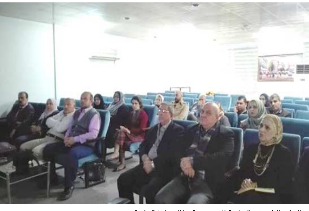
مناقشة: التعليم الطبي في الجامعة المستنصرية خلال مناقشة علمية

ديالى وبغداد تنانان براءة إختراع مادة مثبطة للأنزيمات المحللة المستنصرية تناقش زيادة ممانعة الأنسولين على مستوى الخلية