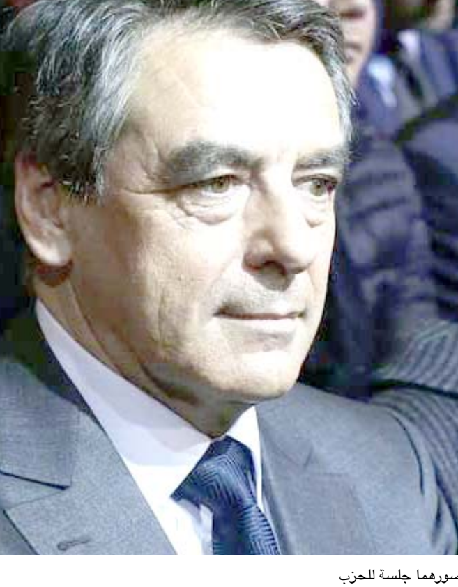
جلسة: مرشح اليمين الى الانتخابات الفرنسية فرنسوا فيون برفقة زوجته خلال حضورهما جلسة لل حزب

كنت احضر لزوجي ملاحظات ومذكرات حول المناشيات المحلية في الدائرة لكي يتمكن مع مذكراتي من لقاء خطابات. واصافت "كنت اعد له نوعا من نشرة مختصرة للصحافة المحلية. كنت امثله في فعاليات. كنت اقرا الخطابات التي سيلقيها. كنت دوما مشاركة في خياراته السياسية. لديه ثقة تامة بي وبمكتمي وكذلك ايضا باخلاصي. كنت اقول له الحقيقة وهو ما لم يكن موظفون يفعلونه يوما". مضددة على انها "خالفا لآخرين فانا لن اتخلي عنه ابدا". وأكدت فيون ان زوجها كان بحاجة لان يقوم احد ما بانه المهام المتنوعة جدا. ولو لم يكن انا هذا الشخص لكان سيدفع لشخص آخر ليقوم به، فقربنا ان يكون هذا الشخص هو انا. ووضحت زوجة فيون انها ظلت تعمل مساعدة برلمانية لمارك جويار، النائب الذي حل محل زوجها في المقعد النيابي، لان النائب الجديد لم يكن معروفا مثل زوجها وعملها الى جانبه كان يوفر له شرعية.