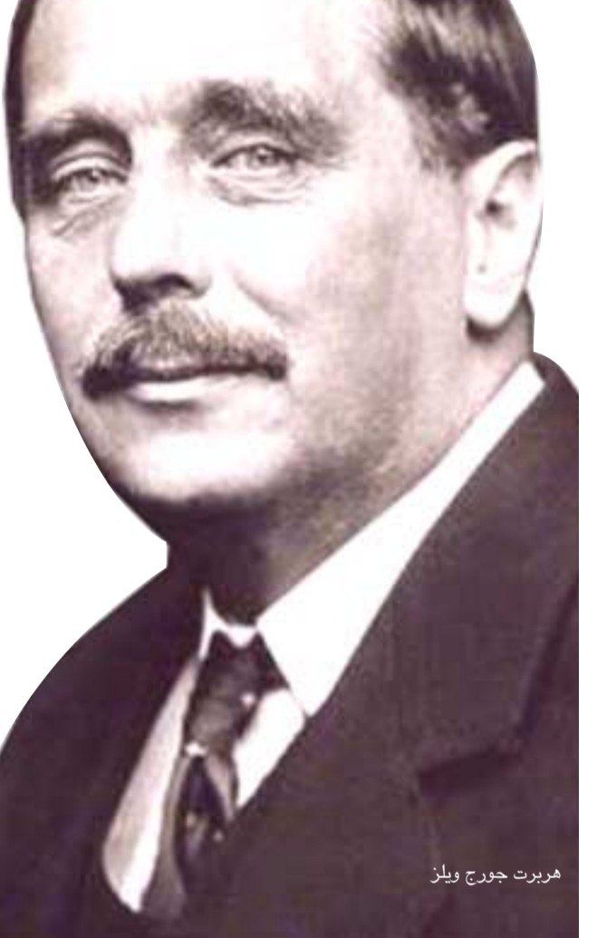
هيربرت جورج ويلز

لما تقدم ويلز العمر ابتعد نسبياً عن الكتابة الروائية القائمة على الخيال العلمي واتجه نحو الروايات الواقعية من ناحية ونحو الكتابة و "النبوءات" السياسية والفكرية من ناحية ثانية. وضمن الإطار الأخير يأتي كتابه: " شكل الأمور التي ستأتي أو شكل الأمور في المستقبل Come To Things of Shape" أصدره عام 1933 وسيطر فيه رؤياه المستقبلية لمستقبل العالم حتى عام 2106 ولكن بصورة استعادية عبر مراجعة أوراق دبلوماسي متخيل هو الدكتور فليب رافن. يتكون الكتاب من خمسة أقسام أو كتب هي: (1) اليوم وغدا: عصر فجر الإحباط - تاريخ العالم حتى 1933. (2) الأيام بعد الغد: عصر العالَم - 1933-1960. (3) عاصم عصر النهضة: ولادة الدولة الحديثة - 1960-1978. (4) الدولة الحديثة - 1978-2059. (5) الدولة الحديثة في السيطرة على الحياة - 2059 إلى يوم رأس السنة الجديدة 2106. النبوءة المشؤومة: الحرب العالمية الثالثة ستشتعل شرارتها من البصرة: وقد راجع المحلل السياسي والتاريخي الأمريكي الدكتور "دنيس كودي" كتاب ويلز هذا وأقتبس منه على الصفحة 50 من