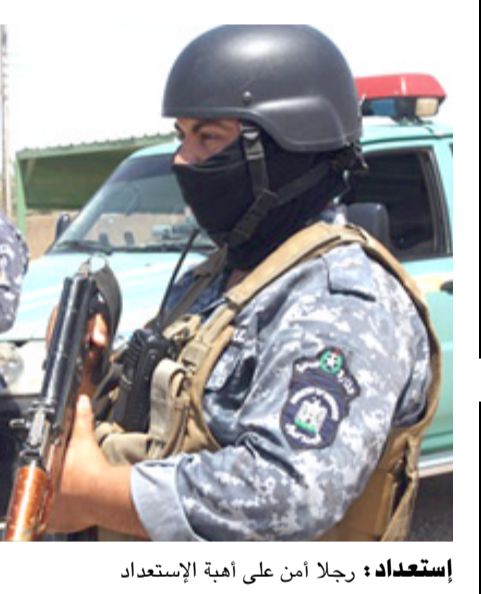
إستعداداً : رجال أمن على أهبة الإستعداد