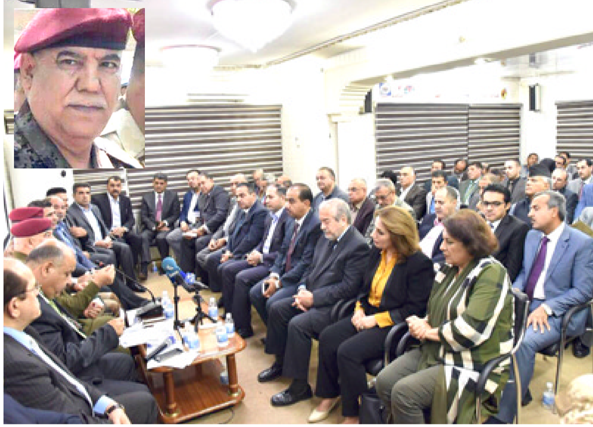
مؤتمراً : قائد عمليات بغداد خلال مؤتمر أمني بحضور

الشركة المتخصصة بأعمال الصيانة إلا أنه مازال معلقاً لغاية الآن). وأضاف المطالب أنه (ويعد السؤال والاستفسار عن سبب عدم افتتاح المجلس تأكدنا بأن ثلاث جهات رسمية وهي مجلس الوزراء ووزارة البلديات وامانة بغداد). مبيّن ان (كل واحدة ترمي الكرة في ملعب الآخر مما جعل القرار يتوزع بين هذه الجهات وذلك للتخلي عن المسؤولية).