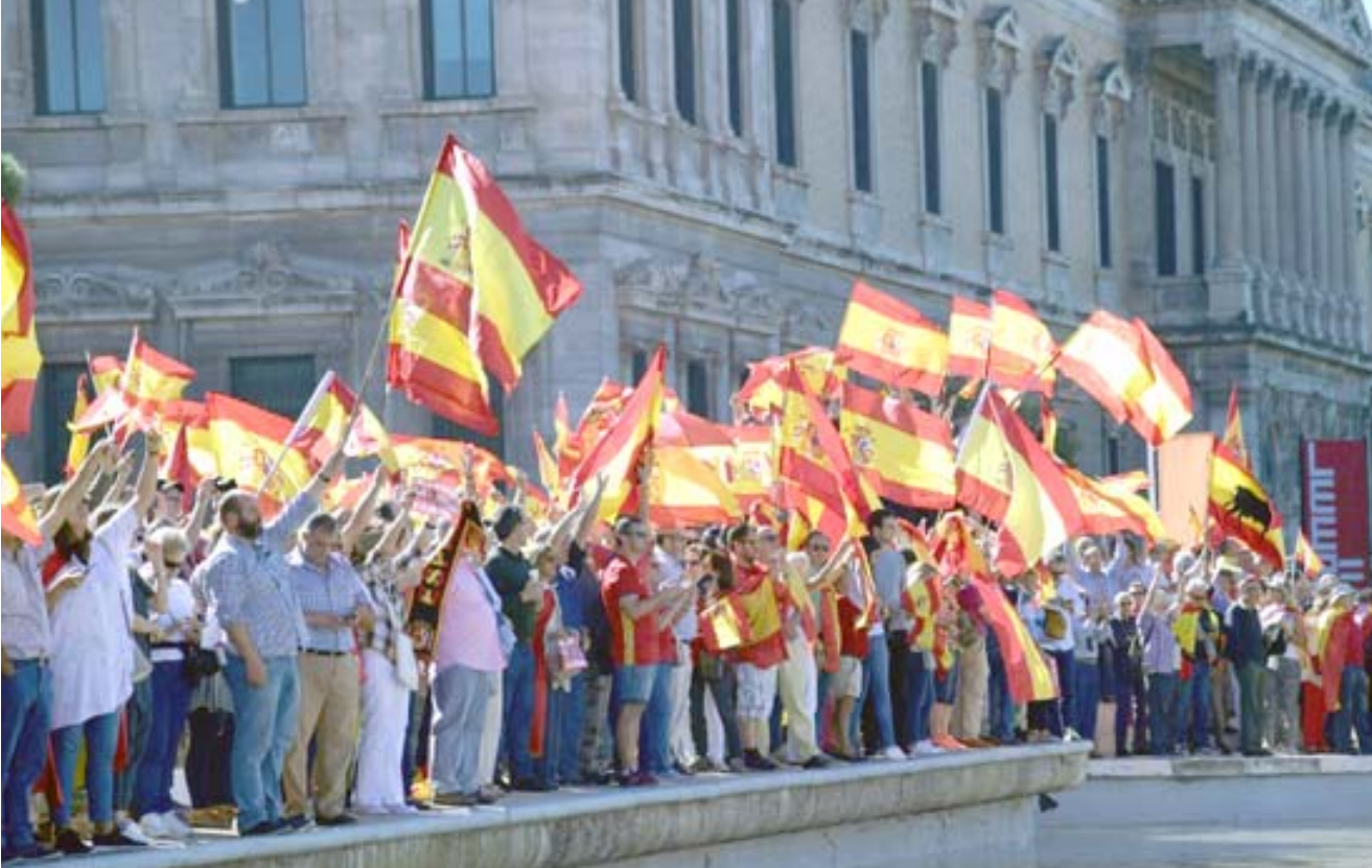
مسيرة: الالف اسباني يتجمعون في ساحة كولون وسط مدريد في مسيرة وطنية دعا إليها الناشطون للدفاع عن وحدة البلاد

ووجد راخوي في مقابله التأكيد على رفضه المطلق للنقاش في وحدة اسبانيا ومطالبين بتحرك لحل الاحوال ان نتحدث تحت التهديد، وذلك في الوقت الذي يمكن ان يلجا فيه قادة الاقليم، بحسب معلومات صحافية، الى إعلان استقلال يدخل حيز التنفيذ بعد فترة زمنية معينة. لكن راخوي رفض رفضاً باتاً هذا الخيار، مؤكداً انه سواء اكان إعلان الاستقلال يدخل حيز التنفيذ "غداً" وملا حشد، جميعهم بلباس ابيض