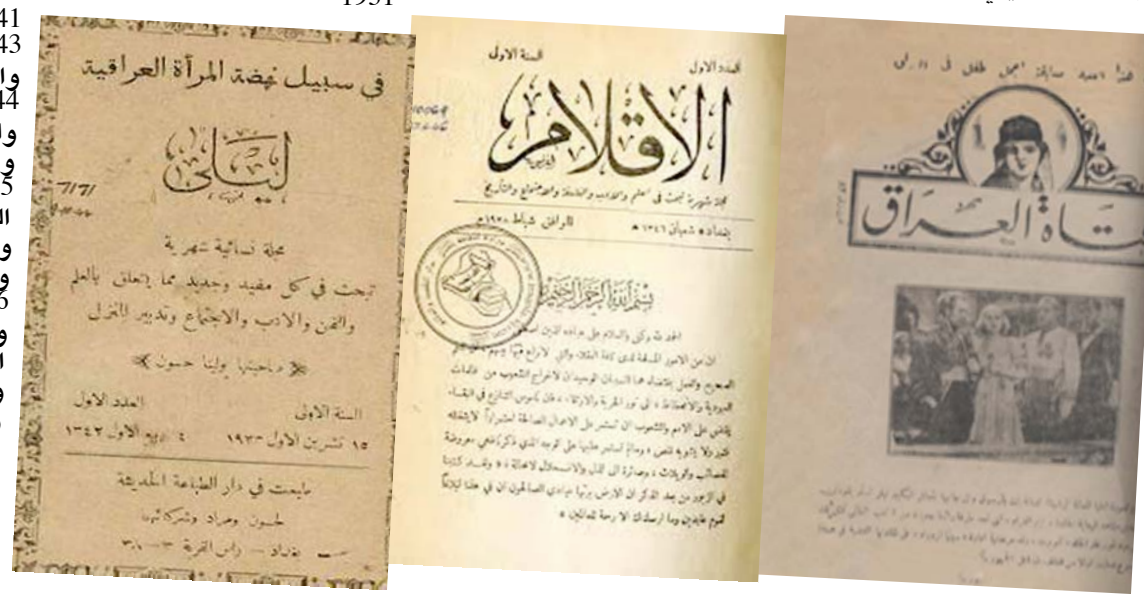
بعض اغلفة مجلات الحقبة الملكية

في سلسلة تراث بغداد كانت لنا كلمات عن المجلات الصادرة ببغداد في العهد الملكي اي من سنة 1920 الى قيام النظام الجمهوري في تموز 1958 ويلاحظ كثرة المجلات الصادرة في تلك بحيث تزيد على عدد المجلات الصادرة في بغداد منذ العهد الجمهوري حتى ساعة كتابة هذه المقالة سنة 2017 على الرغم من التطور الحاصل وعلى الرغم من القدرة الزمنية وعلى الرغم ان اصدار المجلات كان يشترط موافقة الحكومة ومن صراجعة المجلات الصادرة في بغداد نجد مايلي:-