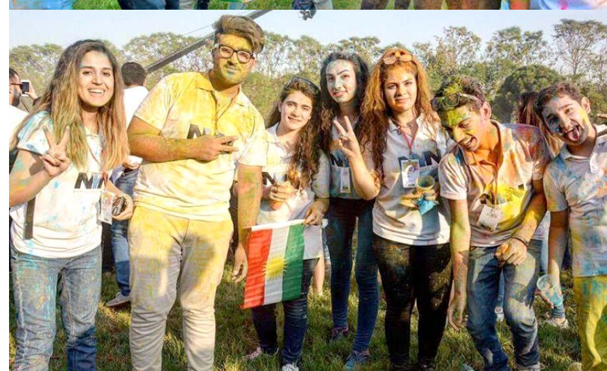
مهرجان : شبان في أربيل خلال مهرجان الانوان الذي ضمهم وسط اجواء الامصار على اجراء استفتاء الاقليم

(الدعوى التي اقيمت امام المحكمة قدمت من جانب النواب المالكي ونصيف لوطال لقرار الإستفتاء). وتابع ان (قرار المحكمة الاتحادية اصبح حجة على الجميع فضلاً على انها أعلى سلطة قضائية). وأضاف ان (الاجتماع الدولي والامم المتحدة بقرارات قرارات المحكمة الاتحادية، والستور العراقي اكد اللجوء الى المحكمة الاتحادية عند حصول اي خصومة بين الإقليم والمركز).