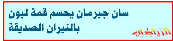
سان جيرمان يحسم قمة ليون بالنيران الصديقة

توقعت الهيئة العامة للأنواء الجوية والرصد الزلزالي التابعة لوزارة النقل ان يحسّر تدريجياً تاخر امتداد المنخفض الجوي الحراري الموسمي على اجزاء العراق مما يؤدي الى انخفاض في درجات الحرارة في المنطقين الوسطى والشمالية و معدلاتها وسكون طقس اليومين المقبلين غائماً جزئياً ، ودرجات الحرارة مغاربة لليوم السابق، فيما أعلنت الهيئة ان هزة أرضية وقعت بعد 38 كيلو مترا من مركز قضاء عفره ولم تتسبب بخسائر بشرية ومادية، واكدت الهيئة في بيان ان (هزة أرضية بقوة 3.3 درجة على مقياس ريختر ضربت ، فجر امس قضاء عفره ، التابع لحافظة نهد) ، وأضاف البيان ان (الهزة وقعت بعد 38 كيلو مترا من مركز القضاء وانها لم تتسبب بخسائر بشرية ومادية).