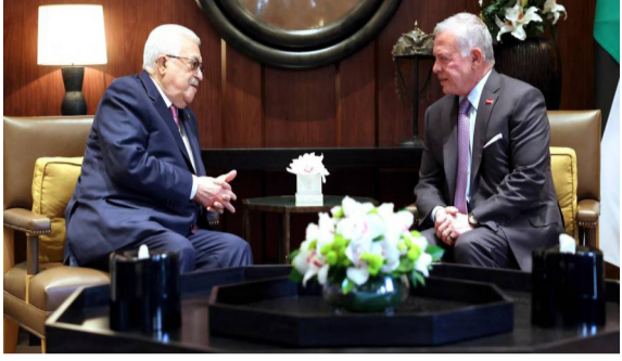
عمان - رند الهاشمي

التقى العاهل الأردني عبدالله الثاني، الرئيس الفلسطيني محمود عباس، لمناقشة تداعيات الحرب على قطاع غزة وتأمين المساعدات الإنسانية والإغاثية للفلسطينيين. وقال بيان تلقته (الزمان) أمس ان (العاهل الأردني استقبل في عمان الرئيس الفلسطيني، واستهل اللقاء بحضور ولي عهده الحسين بن عبدالله، بالتحديد من استمرار الحرب على غزة خلال شهر رمضان، وما يمارسه سيزيد من خطر توسع الصراع)، وشدد على ضرورة بذل أقصى الجهود للتوصل لوقف فوري ودائم لإطلاق النار في غزة، وحماية المدنيين الأبرياء، مشيراً إلى ان (الأردن سيواصل توفير المساعدات الإنسانية والإغاثية والطبية إلى سكان القطاع)، محذراً من التصعيد الإسرائيلي في الضفة الغربية، وما يمارسه المستوطنون الخطرفون بحق الفلسطينيين، والانتهاكات على المقدسات الإسلامية والمسيحية في القدس، وأعاد العاهل الأردني تأكيد رفضه محاولات للفصل بين الضفة الغربية وقطاع غزة، التي تشكلان امتداداً للدولة الفلسطينية الواحدة، داعياً إلى (إدانة التنسيق العربي خلال المدّة المقبلة لإيجاد حل