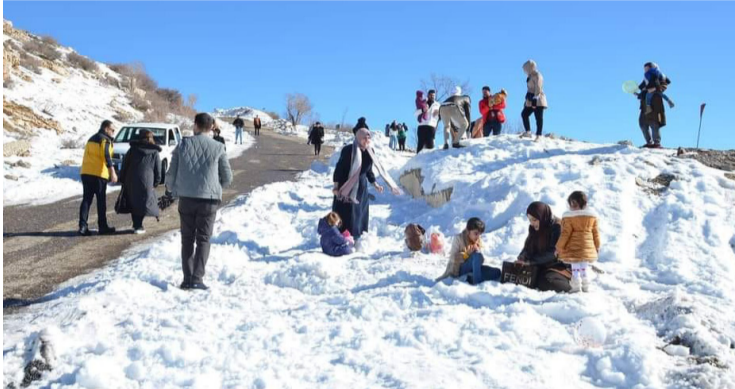
تلوج الرداء الأبيض من التلوج يغطي قمم جبال دهوك