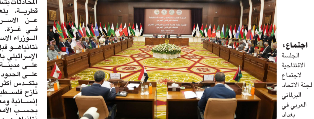
اجتماع الجلسة الانتخابية لاجتماع لجنة الاتحاد البرلماني العربي في بغداد

المحادثات بشأن اتفاق بوساطة قطرية، يتعلق بالإفراج عن الأسرى المحتجزين في غزة. ووجه رئيس الوزراء الإسرائيلي بنيامين نتانياهو قبل يومين، الجيش الإسرائيلي بالتحضير لهجوم على مدينة رفح الواقعة على الحدود مع مصر، حيث يتكسد أكثر من 1,3 مليون نازح فلسطيني وسط ظروف إنسانية ومعيشية بائسة، بحسب الأمم المتحدة. وتعددت الهجمات العسكرية بالقرى (وحده الضغط العسكري المتواصل حتى النصر الكامل سيؤدي إلى إطلاق سراح جميع