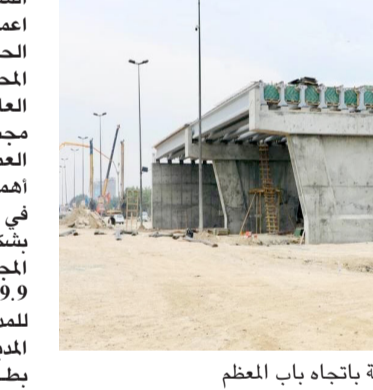
مجمرة: استمرار العمل في مجسر جميلة باتجاه باب المعظم

فضل النتائج في إنجاز المشاريع الخدمية لاسيما الخاصة بتوفير الماء الصالح للشرب.