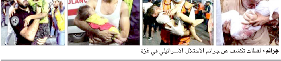
جرائم: لقطات تكشف عن جرائم الاحتلال الإسرائيلي في غزة