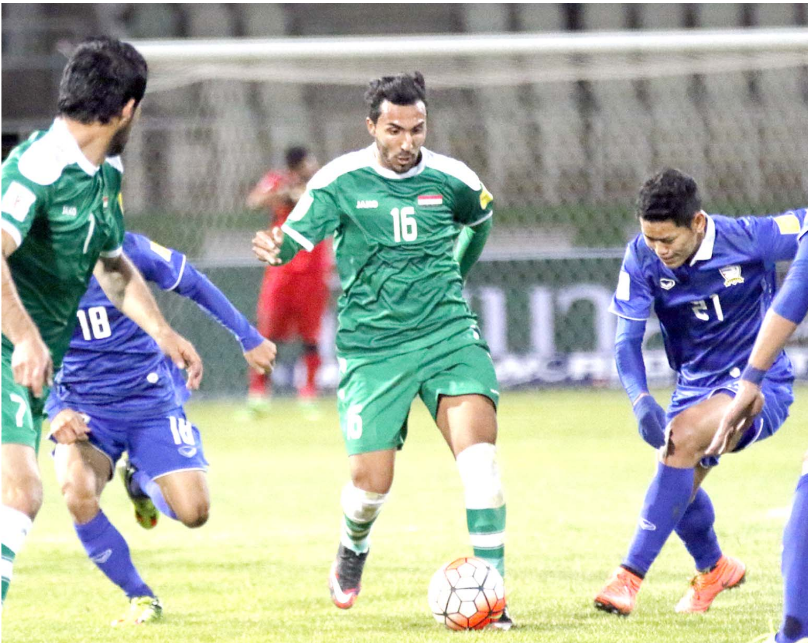
استعدادات: ينطلق المنتخب الوطني لكرة القدم الخميس إلى ماليزيا للدخول في معسكر تدريبي

سبرتبط بمفاوضات مع الإتحاد في حال إبرام العقد ساعتر ذلك الأندية التي أبدت رغبتها بالتعاقد معي وإن لم تتفق مع الإتحاد العراقي سأختار العرض الأفضل وفي كل الأحوال سواء تم الاتفاق مع الإتحاد أم لا فإن الطاقم الحالي سيقدّم المنتخب العراقي في مباراتي تايلاند والإمارات ضمن التصفيات وتسبقها مباراة سوريا الودية في ماليزيا.