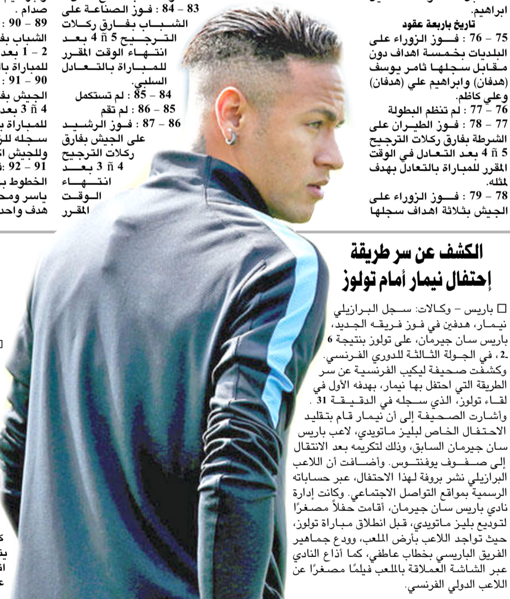
اللاعب الدولي الفرنسي

وهي صفات أيضاً راقت مستواه الفني طوال الموسم الماضي. ستيفن جيرارد قائد ليفربول سابقاً وجه انتقاداً حاداً لأوزيل ووصفه بالغير مسؤول بسبب رفضه القتال مع الفريق حين فُقدت الكرة، فيما لم يتوقف الأمر هنا، حيث نشر الكاتب البريطاني كيون مقالاً في صحيفة ديلي ميل تحت عنوان...أوزيل أكثر لاعب محبب في تاريخ أرسنال. إنه لاعب متدرب، وفي الحقيقة أوزيل يدعو للإحباط حينما تشاهده باللعب، ربما تستمتع ببعض تمريراته، لكنه ستكون مستاء وليس تقديراً اداء يدعو للإحباط.