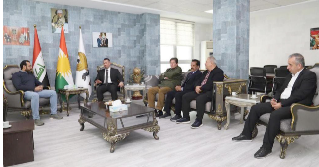
وفد: زيارة الوفد العراقي للتنس في أربيل

بغداد- مسرة الشمري في ختام الاختبارات التي جرت في أربيل، قام وفد الاتحاد العراقي للتنس بزيارة مدير عام رياضية محمود، كما وحضر الاجتماع