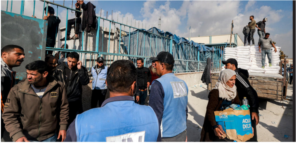
مساعداً: عاملون في أونورا يوزعون مساعدات على السكان في رفح جنوب قطاع غزة