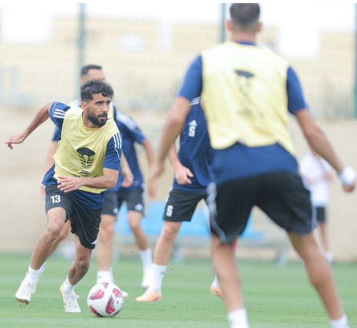
تدريبات: تدريبات اخر وحدة تدريبية يخوضها المنتخب الوطني قبل مواجهة الأردن

تاهلنا ثالثة لكن الامور ستكون امامنا... تواجهنا مجموعة مختلفة فقط البحث عن الفوز... ويتكون المدرب قد عالج اخطاء اللاعبين