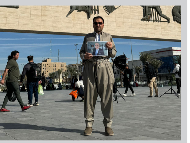
نحن مجموعة ناشطين من مدينة أربيل خلال وقفة في ساحة التحرير في بغداد احتجاجاً على استهداف أربيل من قبل إيران