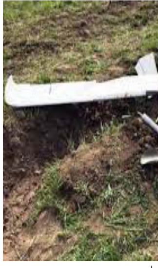
طائرة - بقايا الطائرة المسيرة بعد إسقاطها