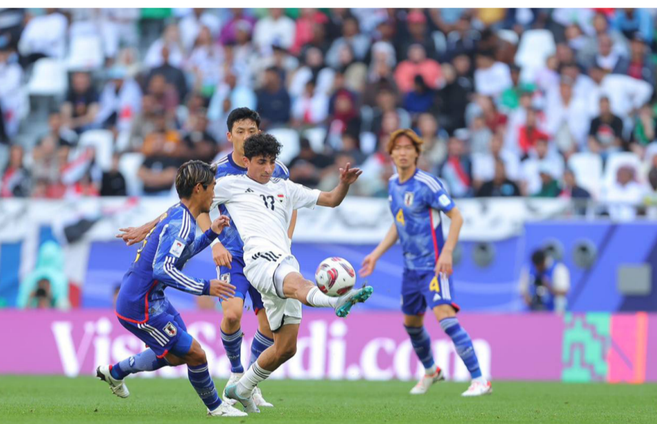
صدارة: اسود الرافدين تخطف صدارة المجموعة بعد فوزها على اليابان

المحمة الكروية بفوز العراق انطلقت معها الإفرح في جميع ارجاء الوطن بعد الاستمطار بالآداء ولسات المدرب الواضحة على خطة واداء لاعبين كما اخذت التشكيل المطلوب الذي قدم اداء تكتيكي عالي بفضل لياقة الجميع بعدما استهل المباراة تحت انظار جمهوره الكبير بضغط قوي وامتلك مفاتيح اللعب والحلول وظهر الجيم بروحية اللعب من اجل الفوز والبحث عن تحقيقه في افضل طريقة وقدم الكمال المجهود الكبير كما استخدم سلاح البدلاء وقدم الجميع قتاري جهودهم وسيروا الامور كما ينبغي وحققوا النتيجة التي غيرت من مشاركة الفريقين وكل شيء اخذ يسير لصالحه الوطني بعد التاهل والبحث عن صدارة المجموعة الإربعاء على حساب فيتنام التي زادت معاناتها بعد الخسارة الثانية.