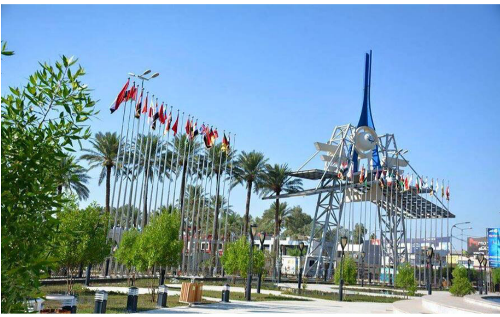
معرض : معرض بغداد يختم فعاليات دورته السابعة والاربعين

بالتفصيل الصناعي لإسمايلا الخاص، وأوضح في تصريح، ان التسهيلات جاءت لمخ تسهيلات لإنشاء المصانع للإمارة المصانع ومنح القروض المبسرة للمستثمرين والصناعيين الراغبين بتوسيع نشاطهم، وتبني الأعمال، ان (القطاعات الخاصة بتجارة الدم والانتعاش من جديد وذلك بدعم حكومي).