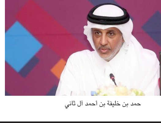
حمد بن خليفة بن أحمد آل ثاني