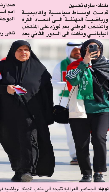
توجه الجماهير العراقية تتوجه الى ملعب المدينة الرياضية في الدوحة