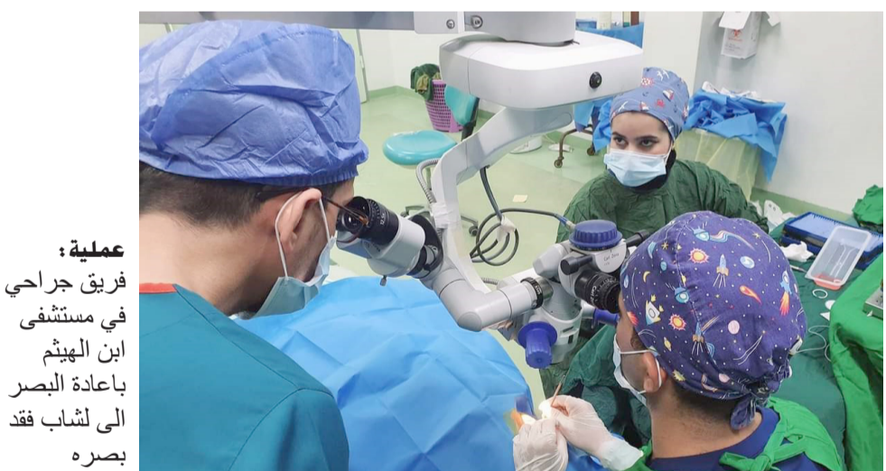
فريق جراحي في مستشفى ابن الهيثم بإعادة البصر الى لشاب فقد بصره

فريق طبي متخصص وكادر التمريض والتخدير المتميز في صالة العمليات الجراحية تم خلالها رفع الماء الابيض وازالة الالتصاقات الموجودة في القرنية وضعف اربطة عدسة العين وقد تكلت العملية بالنجاح كما ينعم المريض حاليا بصحة عينية جيدة وهو في طور المتابعة خلال الأيام القادمة للتأكد من شفائه بشكل تام . الى ذلك وزير الصحة عن وجود تسهيلات للنهوض بالقطاع