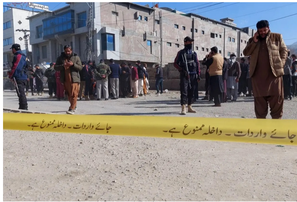
قصف عناصر الشرطة الباكستانية تزامن مع تعرض للقصف الإيراني