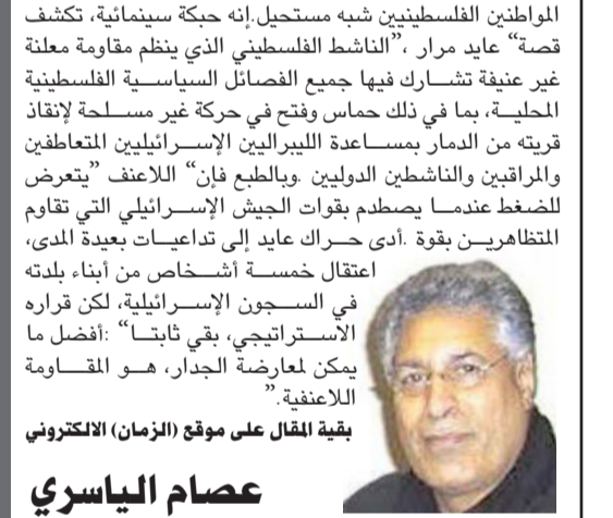
بقية المقال على موقع (الزمان) الإلكتروني