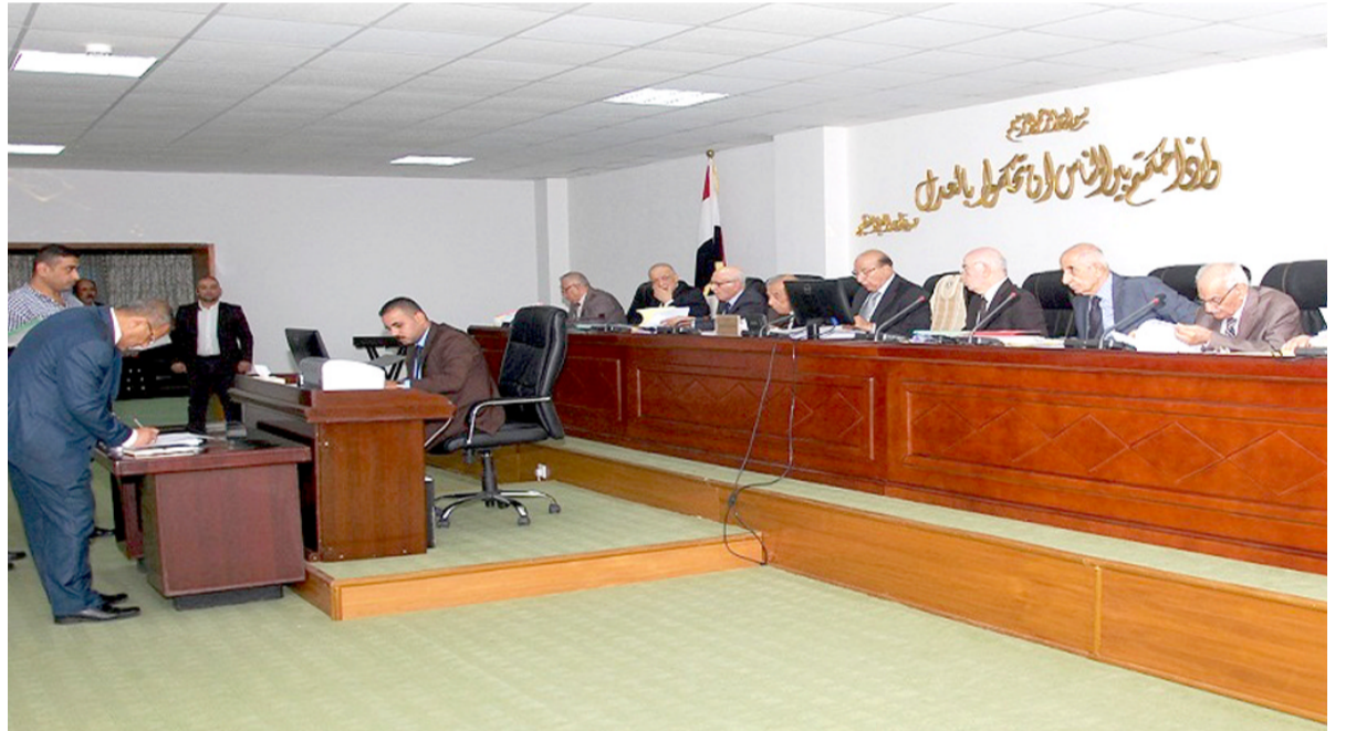
قاعة : جانب من إحدى جلسات السلطة القضائية

بغداد- الزمان قررت المحكمة الاتحادية عدم دستورية فقرة تقصر حق انتخاب مندبي غرف المحامين بمجلس النقابة، عازية السبب الى ان هذه الفقرة تتعارض مع مبادئ الديمقراطية الواردة في الدستور العراقي، فيما تنتظر باربع دعوى مهمة في جلستها. وقال بيان للمحكمة امس ان (المحكمة عقدت جلستها ونظرت في دعوى لطلعن بالفقرة 4 من المادة 87 الواردة في قانون المحاماة) . موضحة ان (المادة 87 من القانون وبعد رجوع المحكمة اليها تبين انها تنص على اختصاصات مجلس النقابة ومنها ما اورده الفقرة 4 المطعون بها المتعلقة بالانصراف على غرف المحامين وانتداب من يختاره مجلس النقابة لإدارة هذه الغرف في غير بغداد) . واضاف ان (الفقرة عدت تعيين مندبي غرف المحامين في دور وقصور القضاء في خارج بغداد مركزياً من مجلس النقابة وليس في النص إلزاما بالرجوع على من تضمه الغرف من محامين لاخذ رايهم في من ينتدب) مبيناً ان (المحكمة وجدت ان الإدارة تعنى الكثير ما يمس حقوق المحامين وتهيئة مستلزمات عملهم ومهامهم مما يستلزم أن يكون للمحامين الذين ينتمون إلى هذه الغرف رأي في اختيار من يدير الشؤون الإدارية) . موضحاً ان (ذلك يكون إعمالاً لأحكام المادة 2 اول ب من الدستور التي لا تجوز سن قانون يتعارض مع مبادئ الديمقراطية وفي مقدمتها كفالة حرية التعبير عن الراي بكل الوسائل كما تشهـير اليه المادة 38 اولاً من الدستور) . مضيفاً ان (من هذه الوسائل حق الانتخاب من يمثل المحامين في إدارة شؤون أعمالهم خارج بغداد في ضوء صراحة نصوص الدستور المتقدم ذكرها التي تؤكد حق الاختيار في من يدير الشؤون الإدارية للمحامين) وتابع البيان ان (المحكمة وجدت ان الفقرة 4 المادة 87 من قانون المحاماة تتعارض مع احكام المادة 2 اول ب والمادة 38 من الدستور) .