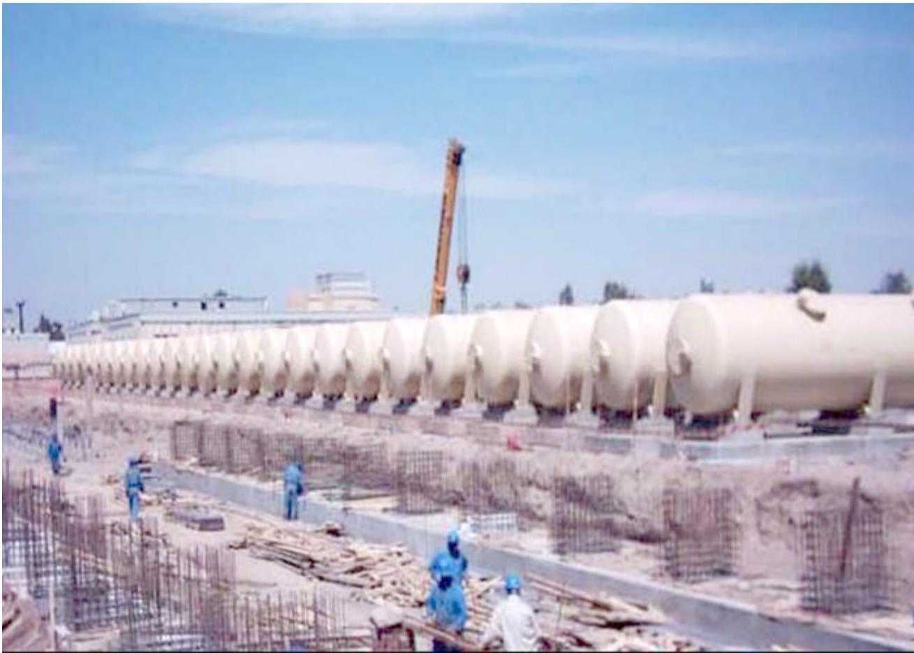
مشروع: احد مشاريع المجاري في المحافظات