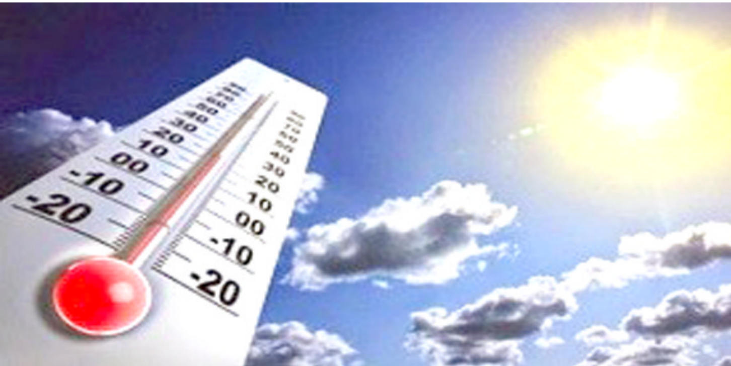
مقياس : مقياس لدرجة حرارة الجو