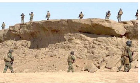
بغداد - الزمان

نجح الحشد الشعبي، في اثناء خطر معسكر لداعش بعد نقطة الانطلاق خلاياه من عمق تلال حميرين صوب ديالى ومحافظتي كركوك وصلاح الدين، فيما اصيب ثلاثة متحاربين خلال اشتباكات مع مجاميع ارهابية ضمن قاطع مطبعية، وقال الناطق باسم محور ديالى صادق الحسيني في تصريح امس ان (معسكر عائشة شكل لمدة ليست قليلة، نقطة انطلاق هيمنة خلايا داعش من عمق تلال حميرين صوب ديالى ومحافظتي كركوك وصلاح الدين بسبب موقعه الاستراتيجي، وأشار الى ان عمليات الحشد النوعية اسهمت في تدمير كل مضافات المعسكر والمسارات البرية المؤدية اليه، مبيّنا ان (المعسكر شكل نقطة تهديد لثلاث محافظات في ان واحد)، وتابع انه (بات من الماضي بجهود وتضحيات الحشد لنذير نجح برغم كل التعقيدات في الوصول اليه وتدمير اوكاره). بدوره، أكد مصدر امّني ان (الفراغ الأمّني ساعد داعش على تاسيس معسكر تدريبي يطلّون عليه اسم معسكر عائشة). واسهمت معسكرات التدريب في تجنيد الكثير من الإرهابيين في أفغانستان والعراق وسوريا واليمن منذ ثمانينيات القرن الماضي. وكان الناطق باسم داعش يدعى أبو محمد العدناني، قبل مقتله بغارة امريكية بثلاثة اشهر، قال ان (هزيمة تنظيمه في الوصول لا تعني نهايته)، مشيراً الى (انهم سيحتاجون إلى الجبال والكهوف، حتى ولو كانت اعدادهم صغيرة). ويعلل المصدر سبب اختيار داعش هذا المكان إلى (عدم وجود