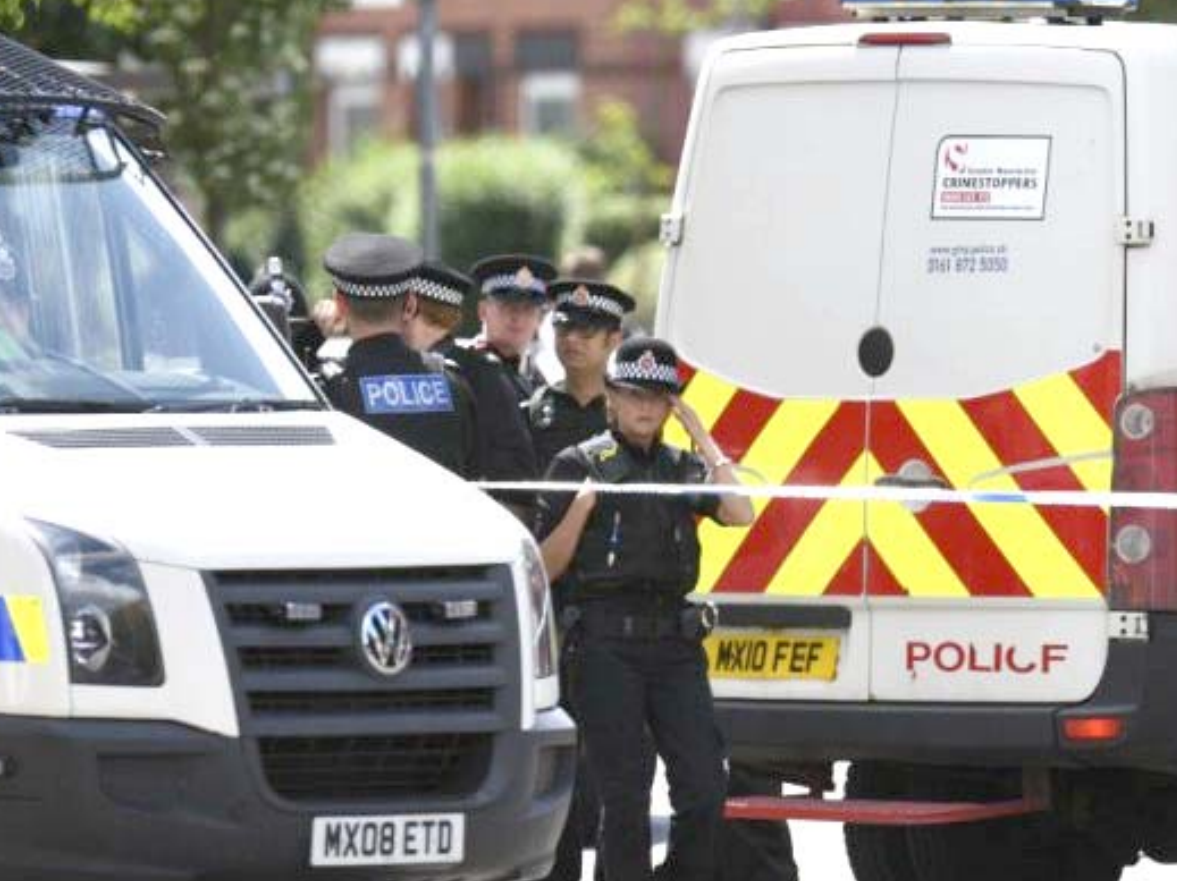
انتشار: الشرطة البريطانية تنتشر في مكان الهجوم في مانشستر