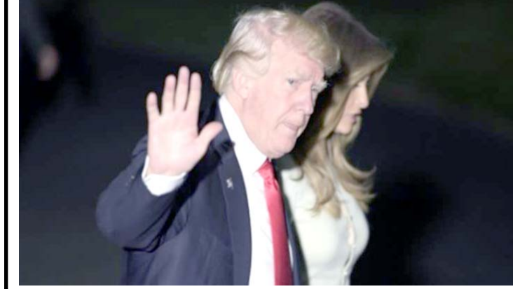
جولة: الرئيس الأمريكي دونالد ترامب وزوجته ميلانيا خلال جولة

واشنطن (ا. ب) - يحاول البيت الابيض الذي يصر بازمة تنديد قلق الرأي العام ازاء التقارير الاعلامية بان صهر الرئيس دونالد ترامب سعى لإقامة قناة اتصال سرية مع الكرملين والتي ندد بها ترامب الابدانها مجرد "أكاذيب". بعد عودته من جولة استمرت تسعة ايام شملت الشرق الاوسط واوروپا، رد ترامب في سلسلة تغريدات على الاتهامات بحق صهره ومستشاره المقرب جاريد كوشنر.