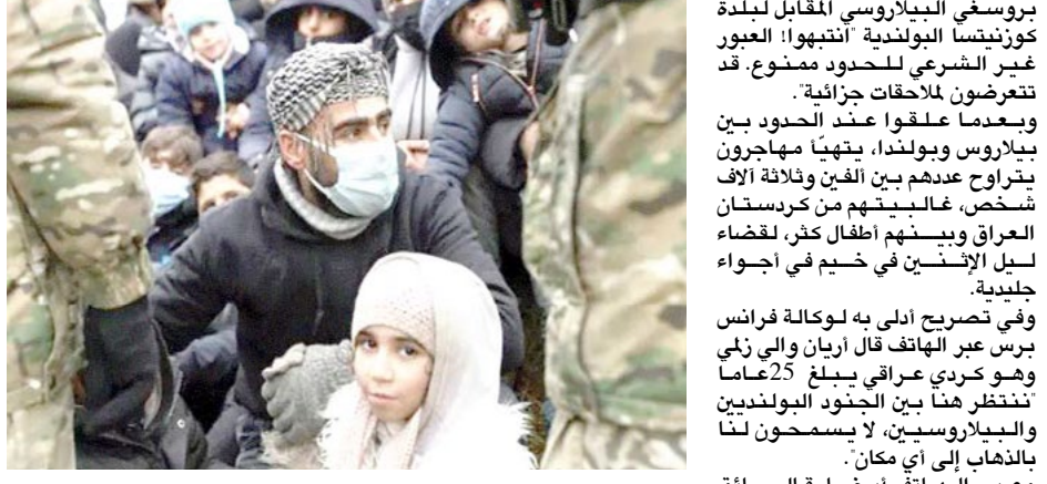
مخيم: مهاجرون يحتشدون في احد المخيمات على الحدود البولندية البيلاروسية

وتعددا علقوا عند الحدود بين بيلاروس وبولندا، بتهدد مهاجرون يترافع عندهم بين الفين وثلاثة الاف شخص، غالبيتهم من كردستان العراق وبعينهم اطفال كثر، لبقاء لسيل الإثنين في خيم في اجزاء جديدة.