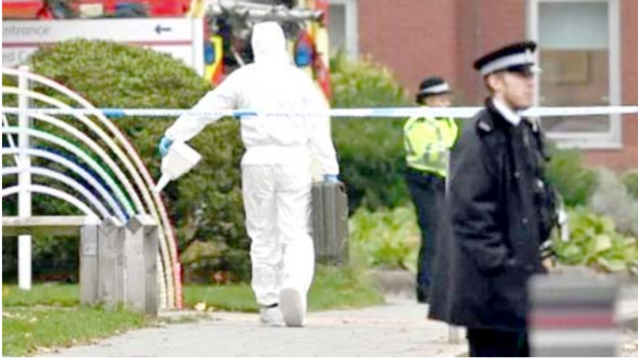
انتشار: الشرطة تنتشر في موقع انفجار ليفربول

بغداد - الزمان القاهرة - مصطفى عمارة نفى المكتب الإعلامي لرئاسة الجمهورية إصدار الرئاسة عفواً عن بعض المتهمين بجرائم الإرهاب والمخدرات وما شابه ذلك، من أساليب تهدف للإضرار بالجماع العراقي. وقال بيان تلقته (الزمان) أمس أنه (فيما ينفي المكتب هذه الأخبار ويشير بسلاسة عن حتمته وقال لها سافا، انا اختلف عنكما إذا غادرت احد لم ولن اعد اليه ابدًا، نعم هذه هي نهاية الحكاية، يا محلي لن ياخذ منها). والشريف ليس صفة شخصية بحالة للشخص، فعدم الشرف هو كل من يسيء بالخلق وبالشرعية الالهية ومن يخون الوطن والامة والدستور والقانون ومن يستغل المنصب والوظيفة لأخذ الرشاش وسرقة المال العام ومن لا يقيم باءه الواجب المكلف به باكمل وجه في خدمة الشعب ومن يخون مهنته ومن يرتد عن الامم والأوجاع الرضوى والفقر والاحتياج في المعانة والادوية الغشوشة والغاشين في التجارة ومن يستغل حاجة الناس في غلاء الاسعار وامثال اخرى لا تحفى عن الانسان اليوم الا المستغلين وهم في الدرك الأسفل منه. فالشرف هو الكرامة والعزة والرؤية والسيادة، وبدونه يصبح الانسان شميما مهما امتلك من المال والجاه والمصنع والحكاية تلك اوجدت غلو الشرف بين المال والطمع فالخوارج قبالان للرحيل والانتقال لا الا لولا فإذا غادر لا عودة له ولذلك نسمع عنه عبر الاثير وخواه الناس عن بعد الاف وربما ملايين الكيلومترات تضرب به الامثال في المجتمعات المحافظة.