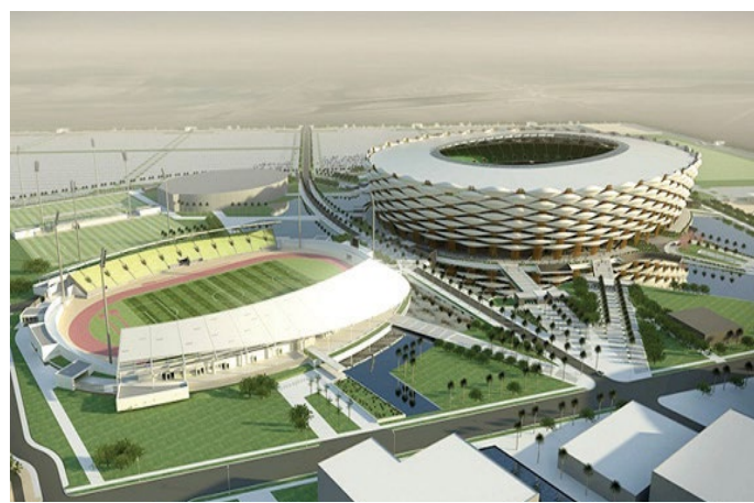
المدينة الرياضية في البصرة

بغداد- الزمان باتت بطولة غرب آسيا لكرة القدم للشباب، مهددة بالإلغاء بسبب إجراءات تتعلق بعودة وزارة الشباب والرياضة. وقال مصدر في وزارة الشباب والرياضة في تصريح صحفي ان العراق لن يتمكن من تنظيم مباراة رسمية في ملاعب البصرة وكربلاء والشعب من قبل الاتحاد الدولي والاسيوي وغرب آسيا. واوضح ان سبب ذلك يعود الى تاجير تلك الملاعب من قبل الوزير الاسبق عبد الحسين عبطان لشركة عراقية بمبلغ 15 مليون دينار سنوياً فقط، بالتالي فان بطولة غرب آسيا للشباب مهددة بالإلغاء. وتابع ان تلك الاتحادات ترفض ان يتم تسليم الملعب فارغاً من اي اعلانات ولكن هذا يتعارض مع العقد الذي ابرمته وزارة الشباب والرياضة في عام 2017 مع الشركة العراقية التي تطالب من كل بطولة ومباراة رسمية ان تكون وارادات الاعلانات لصالح الشركة. ومن المؤمل ان تنطلق بطولة غرب اسيا للشباب بعد اسبوع من الان في البصرة.