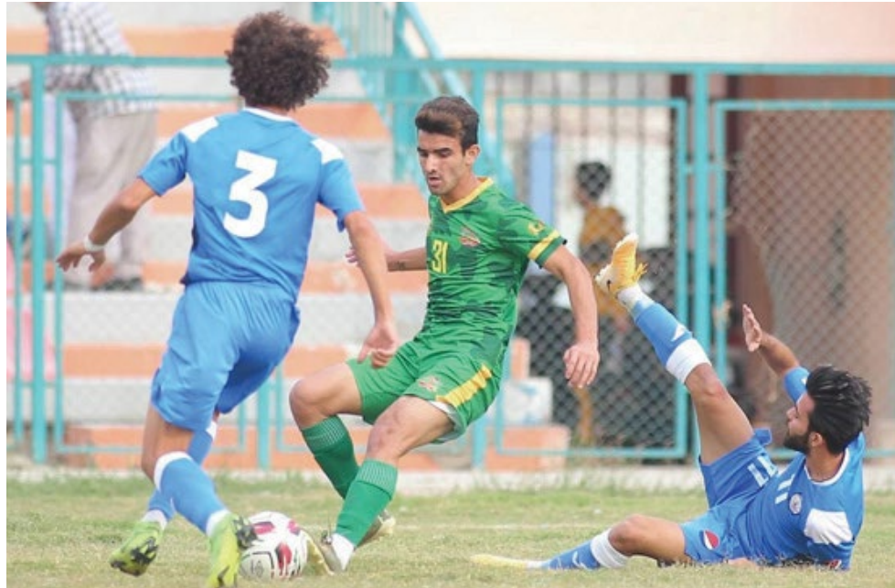
مواجهة، مواجهة فريقي الشرطة والصناعة

بدركون صعوبة المهمة في ظل التحسن الذي عليه اهل الدار فيما يبحث الضيوف عن تعزيز الآمال عبر حسم المهمة ويلتقي فريق الحسين الاخير بابل التاسع ويسعيان سوية للخروج من نفق المنطقة الصعبة ويضيف البحري 5 السادس ديالى التاسع والعاشر 4 ويسعى الى تحسين النتائج والموقف فيما تظهر المهمة ليست بالسهلة لديالى. ويذهب المساواة السابع 5 بسفرة قلقلة الى الشراقات الخامس بذات النقاط في مهمة تميل لاهل الدار ويخرج الوصيف كربلاء للعاصمة وامام فرصة مو اتية للمنافسة على الريادة في مواجهة الجنسية المتراجح للمنطقة الهابطة.