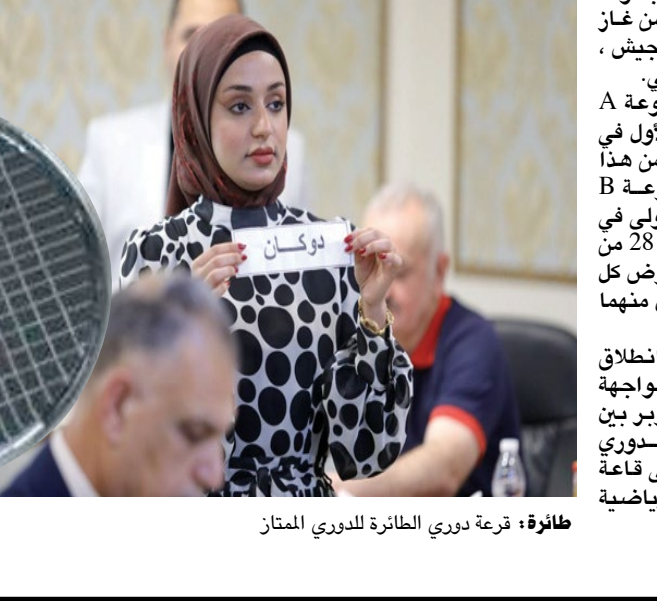
طائرة: قرعة دوري الطائرة للدوري الممتاز