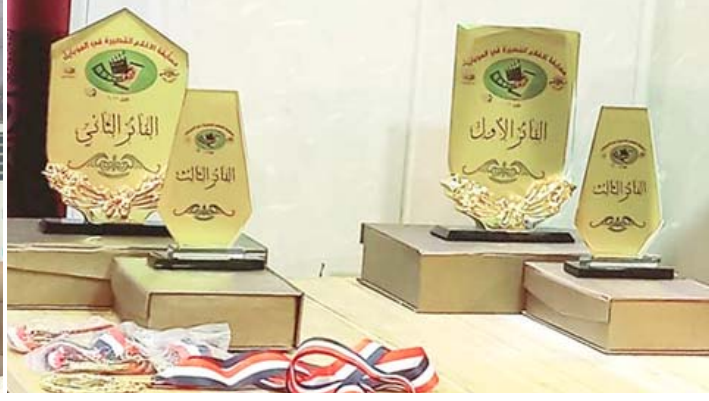
مسابقة: اتحاد الاذاعين والتلفزيونيين يضيف مسابقة افلام الموبايل

وزعت جوائز وشهادات تقديرية للمشاركين. وهنا لآيد من تقديم كل الشكر والثناء لهذه المبادرة المتواضعة في حجمها الكبيرة في دلالاتها ومعطياتها نظراً لما تشكله أفلام الموبايل من أهمية كونها منفذ للشباب للتعبير عن أفكارهم وطموحاتهم ودورها الكبير في إشاعة ثقافة الصورة إضافة إلى إمكاناتها التوثيقية من خلال قدرتها الإمساك بظواهر ومستجدات حركة السواق بحراريتها فعلاً تمنحنا فرصة للتحدث عن الإنسان والعالم.